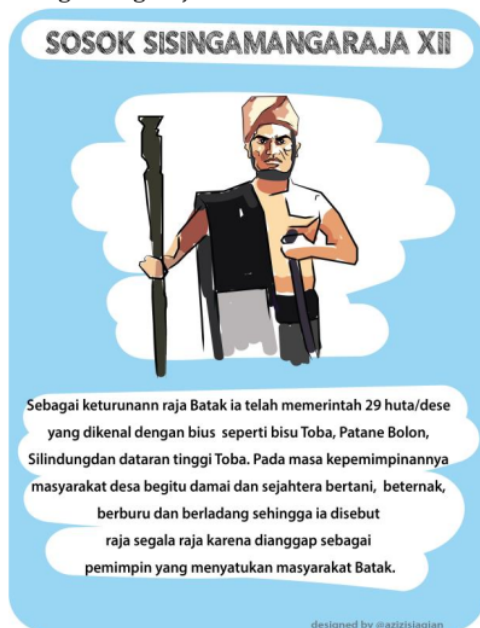
Gambar 2: Storyboard Sisingamangaraja XII (Setiawan, Harahap & Rosnah, 2019)

Tahap ini terdiri dari beberapa tahap yakni pertama adalah membuat sebuah materi naskah untuk pengembangan storyboard dan video animasi. Adapun salah satu contoh storyboard Sisingamangaraja XII adalah: