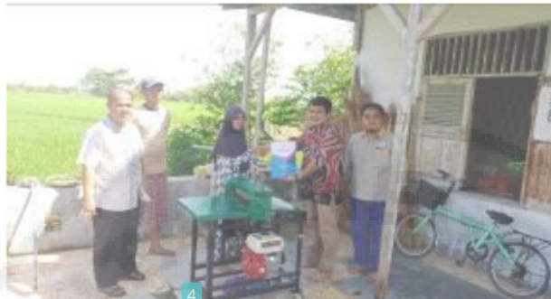
Gambar 2. Pelaksanaan Kegiatan Serah Terima Alat TTG Mesin Pemipih Purun kepada Mitra