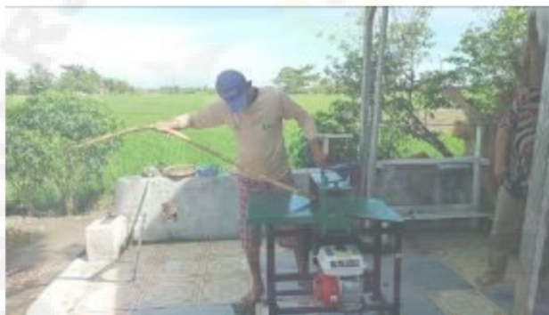
Gambar 3. Pelaksanaan Kegiatan Demonstrasi/Praktikum penggunaan Alat TTG di lokasi Mitra

Lalu dihari berikutnya pelaksanaan kegiatan pengabdian yang diselenggarakan oleh tim pengabdian di lokasi kantor Kepala Desa Cinta Air mitra UMKM Madani adalah pelatihan dan pendampingan pembukuan keuangan usaha sekaligus manajemen usaha (Alinsari, 2020; Astuti & Matondang, 2020). Dari kegiatan ini didapatkan hasil bahwa mitra mampu mengalokasikan segala biaya bahan baku maupun biaya operasional usaha mereka sehingga dalam penentuan harga jual dari usaha mereka dapat lebih efisien dan efektif. Pembukuan kegiatan usaha mitra juga lebih rapi dan lengkap sehingga nantinya pihak mitra mudah untuk mendapatkan bantuan modal dari pihak Bank dan Lembaga Keuangan lainnya (Prasetyo et al., 2020). Keterlibatan tim pengabdian dan mitra dapat dijelaskan pada tabel 2 berikut.