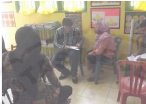
Gambar 4. Pelaksanaan Kegiatan pelatihan dan pendampingan pembukuan laporan keuangan

Diakhir kegiatan juga dilakukan monitoring dan evaluasi program pengabdian untuk mengukur tingkat ketercapaian dari program pengabdian yang telah dilaksanakan pada mitra usaha UMKM Madani seperti dapat dijelaskan pada tabel 3 berikut.