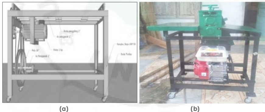
Gambar 1. Desain Gambar Alat TTG mesin pemipih purun sebelum dirancang bangun (a) Hasil Rancang Bangun Alat TTG mesin pemipih purun (b)

Tahapan selanjutnya Tim pengabdian merancang TTG berupa mesin pemipih purun. Rancangan diawali dengan mendesain gambar model mesin pemipih purun tersebut sebelum dirancang bangun dalam bentuk grafis teknikal, sehingga rancang bangun alat TTG tersebut nantinya efisien dan efektif. Alat TTG ini dirancang dengan sistem pengaturan kecepatan sehingga dapat diatur kecepatan dalam produksi. Alat TTG dilengkapi dengan meja yang memungkinkan kualitas yang bagus dalam hasil pipihannya. Adapun spesifikasi alat TTG yang dirancang adalah sebagai berikut: roda penggiling, 1,5 inch, 2 set pisau pemotong, as penggerak 1 inch, per (springs) beserta rumah bearing, belting A75, Poly 4 inch, belting A55, roda penggiling 2 inch, rangka baja UNP 50, dan 4 buah roda trolley.