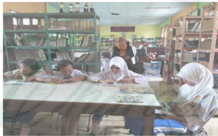
Gambar 2. Reading Group

Aktivitas Reading Group masuk kedalam kurikulum pembelajaran bahasa. Program ini merupakan kegiatan siswa untuk mengasah kemampuan membaca. Reading Group dilakukan didalam kelas dengan membagi siswa untuk berkelompok. 1 kelompok dalam terdiri dari 5-6 siswa. Aktivitas yang dilakukan adalah setiap siswa diminta untuk membaca buku yang telah dipilihnya. Buku-buku yang menjadi referensi yaitu buku yang bercirikan: karakter kuat, sastra yang bagus, dan ilustrasi yang hidup. Setelah siswa selesai membaca, kemudian siswa diminta untuk menceritakan kembali isi buku yang telah dibacanya.