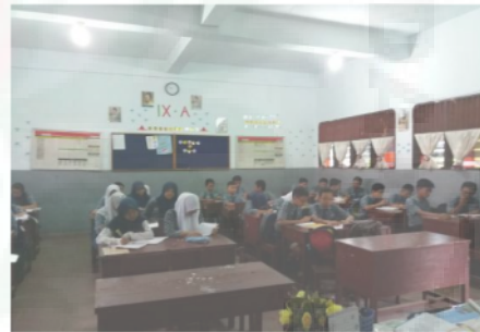
Gambar 3. Program Membaca 15 Menit

Morning motivation juga terintegrasi dalam kurikulum pembelajaran seluruh siswa. Aktivitas ini dilakukan setiap pagi selama 15 menit sebelum para siswa memulai aktivitas belajar mengajarnya. Salah satu bentuk morning motivation ini adalah membaca senyap 15 menit sebelum pelajaran dimulai. Kegiatan ini rata-rata dilakukan satu kali dalam seminggu pada hari jum'at atau sabtu. Kegiatan lain berupa cerita inspiratif untuk memberikan motivasi positif kepada siswa disetiap pagi. Cerita inspiratif bisa berasal dari buku, pengalaman, maupun sumber literasi yang lain. Kegiatan ini melekat pada pelajaran dan dilakukan oleh guru mata pelajaran yang mengajar pada jam pelajaran (les) pertama.