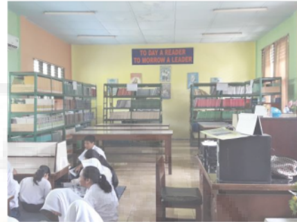
Gambar 7. Perpustakaan sebagai Sumber Literasi

Motto perpustakaan “ Today a Reader Tomorrow a Leader ”. Perpustakaan ini tidak terpisahkan dari misi sekolah untuk mendukung kebijakan Gerakan Literasi Sekolah. Sehingga perpustakaan ini memiliki tujuan: (1) Menumbuhkembangkan minat baca tulis siswa, guru serta karyawan sekolah, (2) Mengenalkan teknologi informasi dengan bimbingan dari para guru, (3) Membiasakan para siswa untuk percaya diri dalam mengakses informasi secara mandiri, dan (4) Mampu memupuk bakat dan minat civitas akademik.