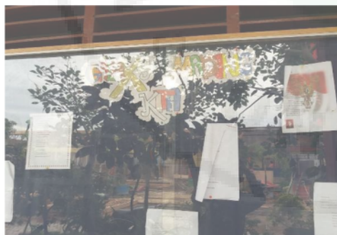
Gambar 8. Majalah Dinding

Program ini merupakan upaya penyediaan sumber informasi yang mudah diakses di luar perpustakaan berupa majalah dinding. Mading ini berisi informasi kegiatan dari perpustakaan dan isu-isu yang mengundang value untuk siswa.