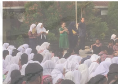
Gambar 4. Program Morning Motivation