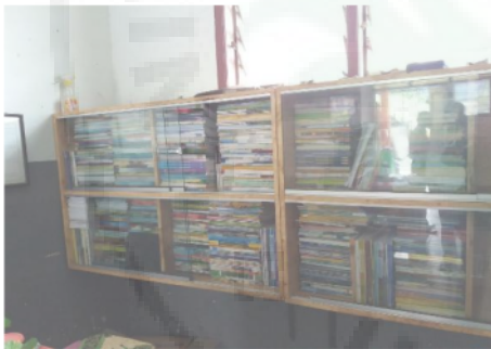
Gambar 6. Pojok Baca

Dari hasil pengamatan, buku yang tersedia di pojok baca tidak mencapai jumlah siswa di setiap kelas. Keadaannya pojok baca di beberapa kelas pun terlihat tidak terawat. Bahkan tidak terlihat siswa menghampiri pojok baca ketika waktu istirahat.