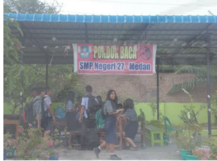
Gambar 5. Pojok Baca

diperkenankan untuk membawa buku dari rumah dan meletakkannya di pojok baca kelasnya agar teman-teman yang lain dapat melihat dan membacanya. Program ini bertujuan agar anak-anak dekat dengan buku sebagai sumber literasi