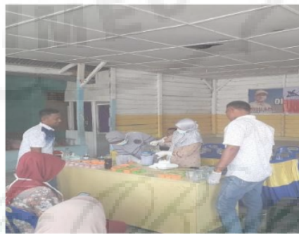
Gambar 1. Proses Pembuatan sabun