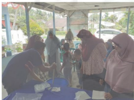
Gambar 2. Olahan Sabun Limbah Jelantah

Pelaksanaan evaluasi dilakukan setelah proses pendampingan dan pelatihan pembuatan sabun padat dan sabun cair, yang ditinjau dari berbagai sisi antara lain sisi kesehatan, kebersihan alat, kebersihan Produk serta kandungan bahan pada sabun dan kerapian sabun pada saat pembuatan (Kartini, K., dkk .2018). Penilaian dalam proses kegiatan menggunakan pengamatan langsung disaat proses pelatihan berjalan dengan menggunakan variable penilaian yaitu: Kandungan Bahan pembuatan sabun, proses pengolahan produk sabun, kebersihan produk, dan kebersihan alat yang digunakan dalam proses pembuatan sabun cair maupun sabun padat.