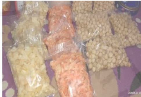
Gambar 2. Produk Olahan Kelompok Zafira Snack