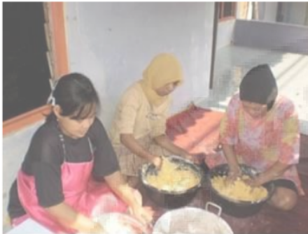
Gambar 1. Proses Pembuatan Produk secara Manual

masih banyak menempel pada produk sehingga teknologi pengeringan produk sangat diperlukan oleh kelompok UMKM ini.