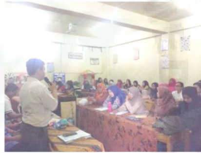
Gambar 1. Sosialisasi Program Dan FGD

tinggi dari peserta dalam penerapan pembelajaran tematik terpadu Kurikulum 2013. Peserta yang bertanya pada umumnya adalah guru-guru yang belum pernah mengikuti pelatihan tentang kurikulum 2013. Berdasarkan diskusi tanya jawab ditemukan adanya guru yang selama ini menerapkan remedial secara keliru karena siswa yang mengikuti remedial akhirnya mendapatkan nilai yang sama dengan siswa yang tidak mengikuti remedial. Dari diskusi pada pelatihan ini juga para guru mendapatkan pengetahuan tentang contoh gambaran rancangan media atau alat peraga yang dapat disiapkan oleh guru sesuai tema dan kompetensi dasarnya dengan biaya yang minim.