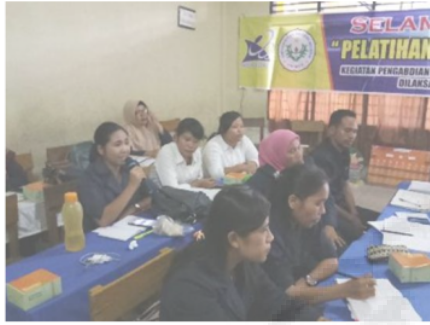
Gambar 4. Peserta Aktif Bertanya