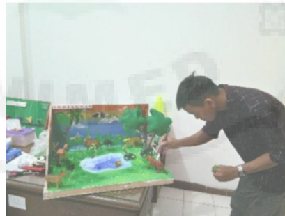
Gambar 6. Pembuatan Model-Model Alat Peraga

Pelaksanaan kegiatan selanjutnya yaitu tim pelaksana merancang dan membuat beberapa model alat peraga pembelajaran tematik dengan jumlah 14 alat peraga. Perancangan jenis alat peraga dilakukan oleh tim pelaksana, sementara untuk pembuatannya dilakukan oleh beberapa mahasiswa yang dilibatkan dalam program pengabdian ini dengan bimbingan tim pelaksana. Dengan melibatkan mahasiswa dalam pembuatan alat peraga ini diharapkan akan berdampak positif bagi mahasiswa sebagai calon guru dalam mempersiapkan alat peraga atau media pembelajaran. Proses pembuatan model-model alat peraga ini berlangsung selama 3 minggu di Laboratorium Media Jurusan Fisika Universitas Negeri Medan.