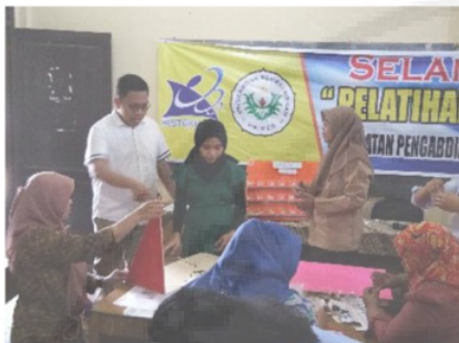
Gambar 7. Pembuatan Alat Peraga Oleh Guru-Guru Peserta Kegiatan

menjadi tugas mereka dalam kelompoknya. Hasil yang diperoleh dari kegiatan ini sejalan dengan hasil yang diperoleh Taneo, dkk (2018) 28 tu meningkatnya kreatifitas guru dalam mempersiapkan alat peraga yang sesuai dengan materi pembelajaran.