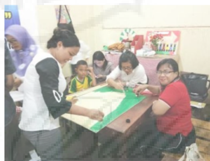
Gambar 9. Peyerahan Alat Peraga Kepada Mitra