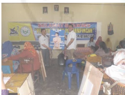
Gambar 8. Guru-Guru Bersemangat Membuat alat Peraga Pembelajaran Tematik

Alat peraga yang dihasilkan dari pelaksanaan workshop ini sebanyak 6 alat peraga yang terdiri dari 3 alat peraga kelas rendah dan 3 alat peraga kelas tinggi. Alat peraga yang dihasilkan divalidasi langsung oleh masing-masing kelompok peserta bersama tim pelaksana. Hasilnya menunjukkan para guru telah mampu membuat alat peraga sendiri dengan kualitas yang baik.