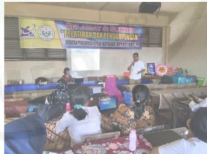
Gambar 2. Pelatihan Pembelajaran Inovatif