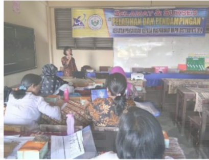
Gambar 5. Workshop Penyusunan RPP K-13

Pelaksanaan kegiatan selanjutnya yaitu tim pelaksana merancang dan membuat beberapa model alat peraga pembelajaran tematik dengan jumlah 14 alat peraga. Perancangan jenis alat peraga dilakukan oleh tim pelaksana, sementara untuk pembuatannya dilakukan oleh beberapa mahasiswa yang dilibatkan dalam program pengabdian ini dengan bimbingan tim pelaksana. Dengan melibatkan mahasiswa dalam pembuatan alat peraga ini diharapkan akan berdampak positif bagi mahasiswa sebagai calon guru dalam mempersiapkan alat peraga atau media pembelajaran. Proses pembuatan model-model alat peraga ini berlangsung selama 3 minggu di Laboratorium Media Jurusan Fisika Universitas Negeri Medan.