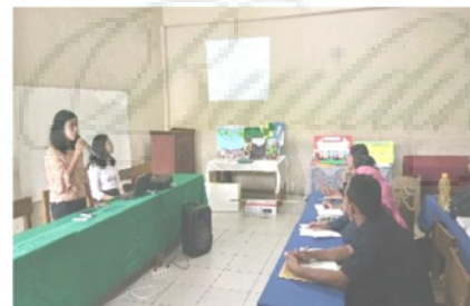
Gambar 3. Pelatihan Kurikulum 2013