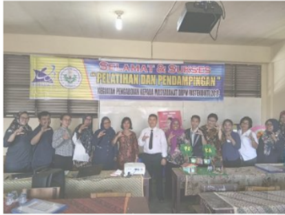
Gambar 10. Foto Bersama Dengan Guru-Guru