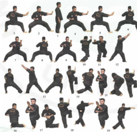
Gambar 4. Kaidah Gerak Dasar I Talago Biru Lanjutan