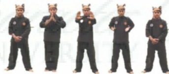
Gambar 1. Gerakan Hormat Perguruan

Hormat perguruan merupakan gerakan wajib bagi murid sebelum melakukan kaidah gerak dasar maupun aktivitas latihan lainnya pada Silek Talago Biru . Pada hormat perguruan 6 i melakukan gerakan mengambil nafas dan m 15 buang nafas serta berdoa didalam hati kepada yang Maha Kuasa Allah S.W.T. Berikut dapat dilihat pada gambar gerakan hormat perguruan dibawah ini :