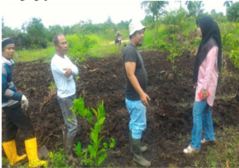
Gambar 3. Proses Pembersihan Lahan KEM

Lahan KEM yang mula-mula masih banyak semak belukar secara 9 rangsur-angsur dibersihkan. Pembersihan lahan dilakukan secara gotong royong oleh anggota Kelompok Tani Juara menggunakan peralatan pertanian yang dibeli dari dana PERTAMINA. Peralatan untuk membersihkan lahan yang dibeli dan digunakan antara lain mesin potong kayu, mesin potong rumput, pisau, cangkul, linggis dan gergaji.