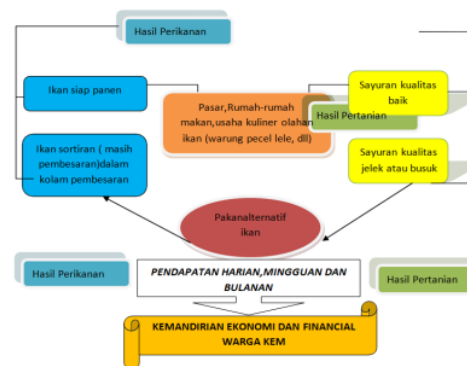
Gambar 2. Diagram Alir Hubungan Antar Komoditas di KEM

Alur hubungan antar komoditas KEM sangat memungkinkan untuk menopang perekonomian warga dengan memaksimalkan pemanfaatan dan pemasaran dari setiap tahap proses komoditas yang di kembangkan seperti terlihat pada Gambar 1.4. Areal KEM berada di sekitar pasar yang buka setiap hari,