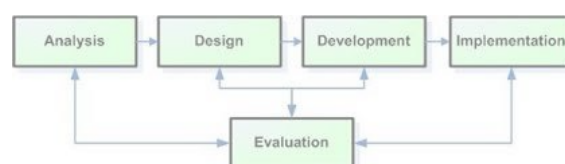
Gambar 3.1 Proses Model ADDIE

Teknik pengembangan yang dilakukan pada penelitian ini adalah Research and Development model ADDIE. Model ADDIE yang merupakan singkatan dari proses pengembangan system pembelajaran yaitu : Analysis (analisis), Design (desain), Development (pengembangan), Implementation (implementasi), dan Evaluation (Evaluasi). dapat di lihat seperti pada Gambar 3.1 berikut.