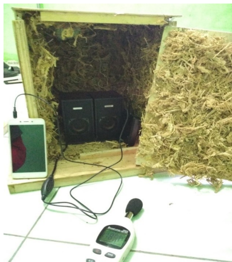
Gambar 2. Gambar Hasil Penelitian