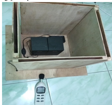
Gambar 1. Alat Pengujian Spesimen