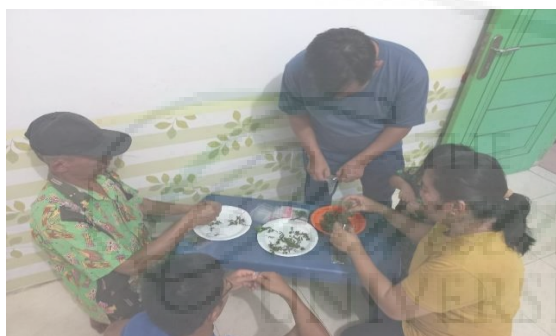
Gambar 4. Tim PKM LPPM Unimed Melakukan Pendampingan Untuk Memasukkan Olahan Daun Mint Ke Dalam Kemasan.