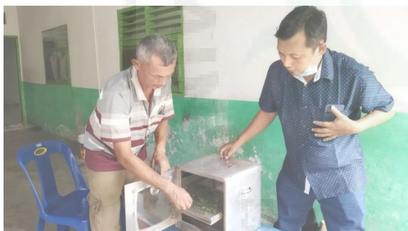
Gambar 3. Tim PKM LPPM Unimed Melakukan Pendampingan Dalam Proses Pengeringan Daun Mint Dengan Memanfaatkan Alat.