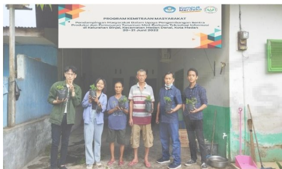
Gambar 2. Tim PKM LPPM Unimed Melakukan Pandampingan Terhadap Masyarakat Dalam Budidaya Tanaman Mint.

rekam melalui dokumentasi kegiatan seperti di bawah ini: