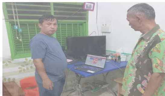
Gambar 5. Tim PKM LPPM Unimed Melakukan Pendampingan Dalam Promosi Hasil Olahan Daun Mint Dengan Memanfaatkan Teknologi Informasi.

Kegiatan ini juga dilakukan bertujuan untuk menghasilkan tanaman mint yang berkualitas. Selain itu, adanya pengolahan daun mint yang lebih baik menjadi teh daun mint dalam bentuk kering akan menambah nilai jual daun mint. Tim Pengabdian Kepada Masyarakat juga melakukan pendampingan terutama dalam pengembangan kuantitas dan kualitas tanaman mint serta pemasarannya dengan memanfaatkan Teknologi Informasi, disamping pendampingan tim PKM LPPM Unimed memberikan alat bantu untuk mempercepat pengeringan daun mint.