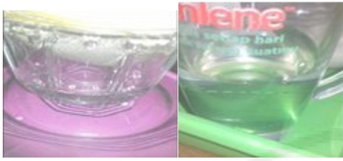
Gambar 6. (a) Pemisahan Air Dengan Sisa Cream (Gelondo), (b) Hasil Penyaringan 2.