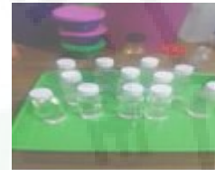
Gambar 4. Proses Penyaringan 1: Pemisahan Air Dengan Cream (Gelondo).

Hasil air bersama gelondo dilakukan penyaringan tahap 1 agar benar-benar terpisah air pendiaman dan gelondo. Penyaringan dilakukan dengan alat saring berupa kain.