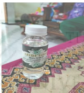
Gambar 8. Hasil Produksi.

Hasil akhir air VCO yang didapat sebanyak 12 botol dengan ukuran 100 ml dari 20 buah kelapa. Pembeli dan pelanggan VCO ini sudah merasakan berbagai manfaatnya sehingga selalu repeat order ke pengusaha. 1 botol VCO ini diberi harga sebesar Rp. 40.000,-/botol.