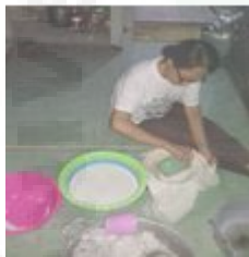
Gambar 7. Packing Dan Labeling.

Proses packing dan labeling dari air VCO yang didapat. Packing dilakukan dengan botol agar lebih efisien. Labeling dilakukan dengan nama “Dapur Mami” kontak whatsapp dan tanggal produksi VCO agar diketahui tanggal kadaluarsa.