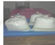
Gambar 5. Proses Pendiaman 2 Hasil Penyaringan.

Selanjutnya hasil penyaringan 1 menghasilkan air yang agak keruh. Air tersebut didiamkan lagi pada tahap pendiaman tahap 2. Tahap pendiaman ini dilakukan untuk memisahkan air yang agak keruh biar terpisah dengan gelondo yang masih terlarut dalam air. Pendiaman tahap 2 ini dilakukan selama 6-10 jam.