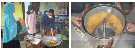
Gambar 6. Pelatihan Penggorengan & Penirisan Tortilla Jagung