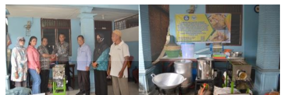
Gambar 3. Serah Terima Mesin & Peralatan Lainnya

Secara garis besar kegiatan PKM ini terbagi menjadi dua, yaitu pemberian materi ( knowledge )