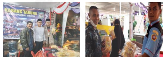
Gambar 8. Pemasaran dan Penjualan oleh Mitra