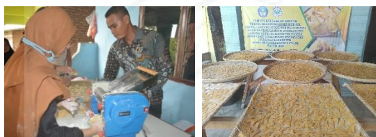
Gambar 5. Pelatihan Menipiskan & Penjemuran Tortilla Jagung