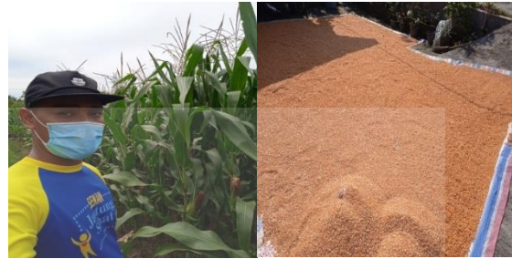
Gambar 1. Mitra Petani Jagung dan Hasil Panen Jagung

Salah satu komoditas utama yang banyak ditanam oleh masyarakat di Desa Pematang Simalungun yaitu jagung dengan luas area kurang lebih 30 ha sehingga saat musim panen jagung, produksi jagung di Desa Pematang Simalungun sangat melimpah. Masyarakat dapat menanam jagung 2 x dalam setahun, rata-rata produktivitas tanaman jagung di Desa Pematang Simalungun sebesar \pm 8 ton/ha, sehingga selama 1 tahun produksi jagung dapat mencapai \pm 480 ton. Melimpahnya produksi jagung saat panen raya di Desa Pematang Simalungu, menyebabkan masyarakat kesulitan dalam penanganan pasca panen jagung sehingga jagung dijual dalam bentuk glondongan, jual basah diborongkan, pipilan basah atau jagung pipilan kering kepada tengkulak/pengepul. Hal tersebut menyebabkan harga jual jagung sangat murah berkisar antara Rp. 3.500 /kg untuk jagung glondongan, Rp. 4.300 /kg jagung pipilan basah dan Rp. 4.800 /kg jagung pipilan kering. Kondisi tersebut secara ekonomi akan merugikan petani karena biaya produksi tidak sebanding dengan harga jual jagung yang murah. Keadaan ini akan di manfaatkan oleh petani jagung untuk mendiversifikasikan produk olahan jagung dengan memproduksi menjadi Tortilla Jagung.