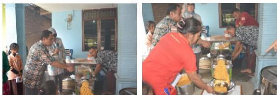
Gambar 4. Pelatihan Penerapan Mesin & Pembuatan Adonan