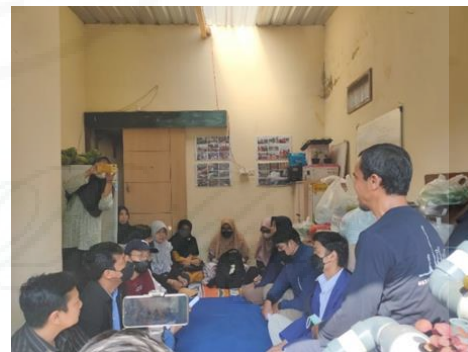
Gambar 3. Kegiatan Sosialisasi dengan Kelompok Wanita Tani Cemara Hijau Farm di Sekretariat.

Pada tanggal 05 Juli 2022 tim melakukan kunjungan kembali setelah membuat janji untuk bertemu dan menyampaikan tujuan pengabdian secara langsung kepada anggota Kelompok Wanita Tani Cemara Hijau Farm. Hal-hal yang disampaikan pada kegiatan sosialisasi ini diantaranya yaitu program pembuatan pupuk organik cair. Dokumentasi kegiatan sosialisasi ditampilkan dalam Gambar 3.