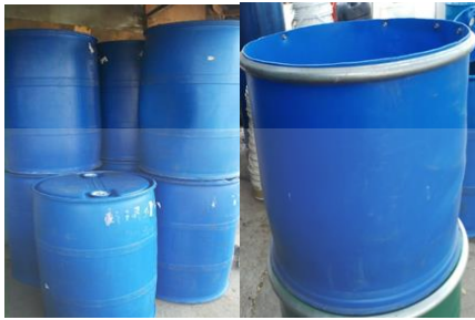
Gambar 4. Fasilitas Tong Komposter.

Pada tanggal 29 Juli 2022 fasilitas tong komposter masih dalam tahap penambahan penyangga tong komposter. Hal ini dilakukan agar dalam pengambilan hasil dari pupuk organik cair yang ada didalam tong komposter lebih mudah. Dalam pembuatan penyangga tong komposter ini memiliki tinggi 50 cm dari atas tanah dan memiliki diameter 40 cm. Desain penyangga tong komposter ditunjukkan dalam Gambar 5.