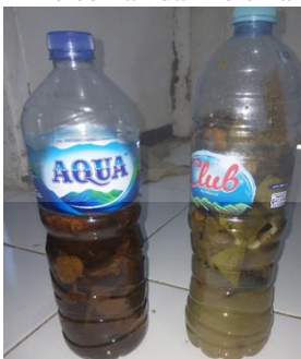
Gambar 6. Hasil Pupuk Organik Cair dari Limbah Organik Kering dan Basah.

Dari proses yang dihasilkan, terdapat dua tipe limbah organik yaitu limbah organik kering dan limbah organik basah seperti pada Gambar 6. Dengan diberikan perlakuan yang sama, maka didapatkan bahwa pupuk organik yang berasal dari limbah organik basah, lebih cepat terurai, daripada limbah organik kering. Hal ini dikarenakan limbah organik basah memiliki kandungan air yang lebih banyak, sehingga dapat membantu proses fermentasi. Untuk pupuk organik cair yang berasal dari limbah kering, sisa limbah yang belum terurai dapat dijadikan menjadi pupuk organik padat. Sehingga dari tipe limbah yang dijadikan pupuk organik cair, masing-masing memiliki kelebihan dan kelemahan.