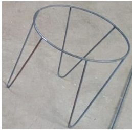
Gambar 5. Tampilan Desain Penyangga Tong Komposter.

Pada tanggal 29 Juli 2022 fasilitas tong komposter masih dalam tahap penambahan penyangga tong komposter. Hal ini dilakukan agar dalam pengambilan hasil dari pupuk organik cair yang ada didalam tong komposter lebih mudah. Dalam pembuatan penyangga tong komposter ini memiliki tinggi 50 cm dari atas tanah dan memiliki diameter 40 cm. Desain penyangga tong komposter ditunjukkan dalam Gambar 5.