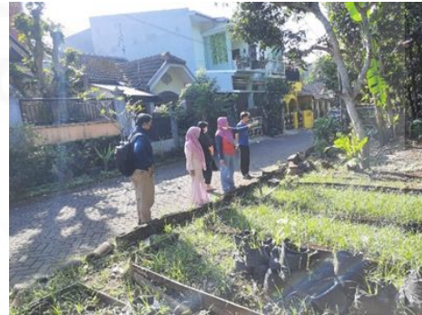
Gambar 2. Sekretariat Cemara Hijau Farm.

pandemi Covid-19. Pada kesempatan tersebut tim melakukan diskusi dan informasi mengenai konsep bersama pengurus Kelompok Wanita Tani Cemara Hijau Farm. Selama diskusi, tim menyampaikan konsep pengabdian masyarakat kepada Pengurus. Kemudian tim diberi kesempatan untuk melihat langsung pekarangan yang akan dijadikan tempat pembibitan tanaman. Gambar pekarangan pertanian Cemara Hijau Farm ditampilkan dalam Gambar 2.