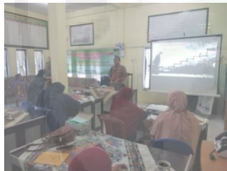
Gambar 1. Penyampaian Materi Kewirausahaan.

diharapkan dapat merubah sikap dan meningkatkan kinerja dari anggota KSU-ED Tabek dalam melakukan usahanya sehingga pengembangan kemampuan kewirausahaan dalam inovasi produk olahan nira tebu dapat tercapai, misalnya inovasi produk olahan nira tebu menjadi gula semut dan gula cetak dengan berbagai bentuk dan ukuran. Menurut Mulyana & Ishartono (2018) persaingan dalam dunia usaha akan semakin ketat sehingga perlu adanya kreativitas dan inovasi usaha dari pelaku usaha. Oleh karena itu jiwa wirausaha bagi pelaku usaha perlu dikembangkan agar seseorang dapat menyelesaikan permasalahan usaha yang dihadapi. Selanjutnya, ditambahkan oleh Danial et al. (2021) bahwa layanan pendidikan yang dilakukan dalam bentuk kursus dan pelatihan dengan tujuan menyampaikan pengetahuan, keterampilan, dan membangun sikap mental wirausaha dalam membenahi kapasitas diri dan lingkungan sebagai persiapan untuk berwirausaha disebut dengan pelatihan kewirausahaan. Penyampaian materi pelatihan kewirausahaan dapat dilihat pada Gambar 1.