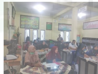
Gambar 3. Peserta Sedang Menyimak Materi Pelatihan.

Pada pelaksanaan kegiatan pelatihan para peserta menunjukkan respon yang positif dan sikap antusias dalam menyimak penjelasan dari nara sumber. Hal ini terlihat dengan bersemangatnya para peserta pelatihan dalam berdiskusi dengan nara sumber. Gambar 3 memperlihatkan respon dan sikap peserta dalam menyimak materi pelatihan.