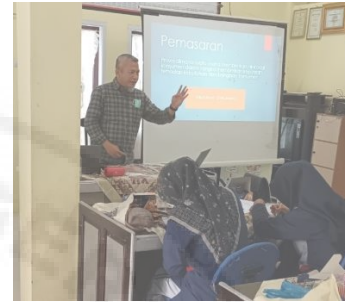
Gambar 2. Penyampaian Materi Strategi Pemasaran.

Penyampaian materi pelatihan strategi pemasaran dapat dilihat pada Gambar 2.