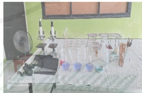
Gambar 4. Penambahan Kelengkapan Sarana Laboratorium.

Setelah sosialisasi dan pemberian materi, peserta langsung melakukan pelatihan praktikum berbasis lingkungan. Sebelum dimulai pelatihan, kepada Mitra diserahkan serangkaian alat-alat praktikum guna meningkatkan kelengkapan standar laboratorium IPA. Beberapa alat yang diserahkan diantaranya mikroskop, beberapa alat gelas serta lemari alat dan bahan. Selain itu bahan praktikum juga disiapkan yang akan digunakan untuk pelatihan.