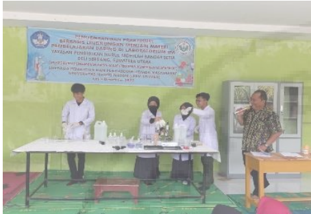
Gambar 5. Kegiatan Pelatihan Praktikum Berbasis Lingkungan.

lingkungan sekitar. Para peserta antusias dalam melakukan pelatihan ini, dilihat dari banyaknya pertanyaan dan diskusi pada saat berlangsungnya pelatihan praktikum.