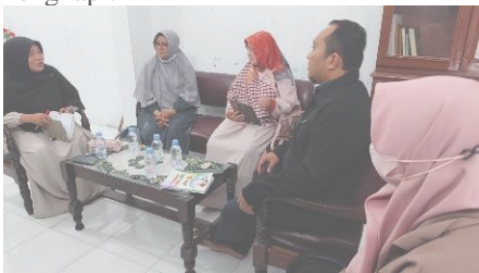
Gambar 2. Kegiatan FGD.

Pada tahap pertama, tim mengunjungi dan menjumpai pihak sekolah untuk mendiskusikan kegiatan yang akan dilaksanakan di sekolah dalam sesi focus grup discussion (FGD). Tim berdiskusi baik dengan ketua Yayasan Nurul Fadhillah, terkait waktu dan lokasi kegiatan yang akan dilaksanakan, maupun dengan guru bidang studi IPA terkait materi/praktikum yang akan dilaksanakan. Pada tahapan ini disepakati jumlah tema praktikum berbasis lingkungan yang akan dikerjakan, serta sarana labortorium yang akan dilengkapi.