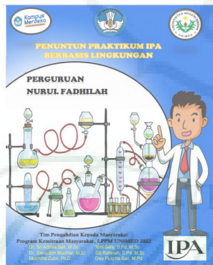
Gambar 6. Modul Penuntun Praktikum.

Mempraktekkan penggunaan alat praktikum dan pengembangan praktikum berbasis lingkungan disertai dengan panduan praktikum sederhana. Sesuai dengan tujuan untuk memberikan pengetahuan dan pemahaman guru dan siswa pada pembelajaran praktikum berbasis lingkungan, maka tim memberikan Buku Penuntun Praktikum IPA Berbasis Lingkungan. Praktikum-praktikum yang ada pada penuntun ini semuanya telah dilatihkan kepada peserta, sehingga peserta dapat mengulang kembali apa yang sudah dipelajari pada waktu pelatihan.