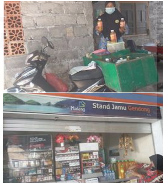
Gambar 4. Pasar Produk Jamu

rumah kerumah menggunakan motor atau digendong dan dikemas dengan botol plastik. Produk jamu instan dikemas dengan plastik diberi label “Andila” dengan PIRT No. 212350705728, komposisi jelas serta tanpa bahan pengawet. Produk tidak saja dijual dari rumah ke rumah tetapi juga menempati salah satu stand kantor pemerintah.