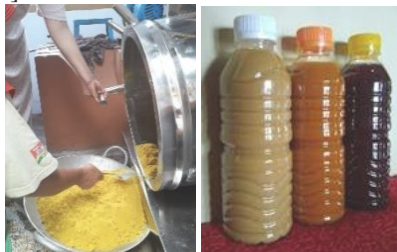
Gambar 3. Produk Jamu Instan dan Siap Minum yang Dihasilkan

Introduksi mesin pemasak minuman rempah instan dapat menghasilkan ekstrak jahe kristal 20-25% lebih banyak, otomatisasi dalam proses pengadukan sekaligus dapat mempercepat pembentukan kristal yang semula berlangsung 3 jam menjadi 2,5 jam, dan produk besaran kristal lebih homogen, lebih halus serta peningkatan keuntungan Rp. 906.000/hari [17][18].