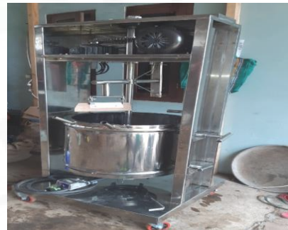
Gambar 2. Spesifikasi Mesin Pemasak dan Pengaduk Aneka Jamu Instan

Kegiatan diseminasi dimulai dengan pembuatan mesin pemasak dan pengaduk jamu instan sesuai kebutuhan pengrajin dengan spesifikasi terlihat pada gambar 2.