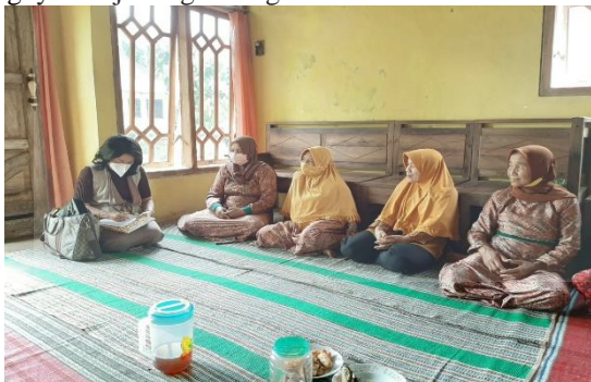
Gambar 1. Proses Koordinasi dan Identifikasi Masalah

Kegiatan diseminasi teknologi dilakukan melalui kegiatan pelatihan dan pendampingan. Kegiatan pelatihan dimulai dengan mengadakan pre-test untuk melihat sejauhmana pemahaman pengrajin jamu gendong atas proses dan manfaat produk, mekanisme perijinan serta manfaat sistem kelembagaan. Kegiatan dikuti oleh 30 anggota aktif paguyuban jamu gendong Kartini.