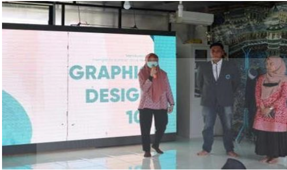
Gambar 2. Proses Pelatihan Pengenalan Dan Pemanfaatan Kompetensi Desain Grafis.

Peserta pelatihan di dampingi oleh fasilitatorpelatihan yang terdiri dari mahasiswa Program Studi Pendidikan Teknologi Informatika dan Komputer (PTIK) dan beberapa orang dosen dari tim pengabdian kepada masyarakat. Pendampinganini dimaksudkan untuk memastikan peserta memahami materi pelatihan dan dapat menyelesaikan sebuah proyek yang ditugaskan. Kegiatan pendampingan diperlihatkan padaGambar 3.