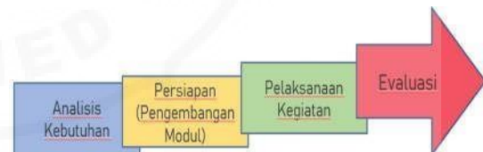
Gambar 1. Tahapan Kegiatan Pengabdian Di Darul Tahfidz Asy Syairun.

Agar metode atau langkah-langkah dari kegiatan pelatihan TIK yang dilakukan tim pengabdian kepada masyarakat di Darul Tahfidz Asy Syairun ini dapat dipahami lebih mudah, maka dapat dilihat alur kegiatan pada Gambar 1.