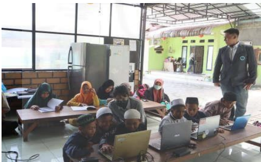
Gambar 3. Kegiatan Pendampingan Peserta Pelatihan Oleh Dosen Dan Fasilitator.

Peserta pelatihan di dampingi oleh fasilitatorpelatihan yang terdiri dari mahasiswa Program Studi Pendidikan Teknologi Informatika dan Komputer (PTIK) dan beberapa orang dosen dari tim pengabdian kepada masyarakat. Pendampinganini dimaksudkan untuk memastikan peserta memahami materi pelatihan dan dapat menyelesaikan sebuah proyek yang ditugaskan. Kegiatan pendampingan diperlihatkan padaGambar 3.