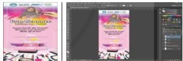
Gambar 3. Rancangan Aplikasi.

Persiapan dilakukan dengan membuat rancangan aplikasi dan mengumpulkan alat bahan yang akan digunakan. Perancangan aplikasi dilakukan sesuai dengan saran dan masukan yang diberikan MUA dan dosen pendamping. Pembuatan desain aplikasi dilakukan dengan menggunakan software photoshop dengan 2 menu utama yaitu filter dan make up Gambar 2.3 Rancangan Aplikasi. Aplikasi Lup Scanner dibuat dengan prinsip yang hampir mirip dengan aplikasi serupa namun tim melakukan modifikasi fitur-fitur yang tersedia dengan menambahkan fasilitas face detection yang dimanfaatkan untuk membantu MUA mengoreksi bentuk wajah konsumen.