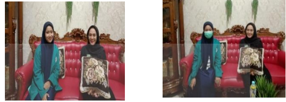
Gambar 2. Wawancara MUA.

Wawancara dilakukan untuk menganalisa permasalahan utama yang dihadapi MUA agar dapat mengambil langkah penyelesaian masalah yang paling tepat berdasarkan hasil diskusi antara tim dengan dosen pendamping yang akan didiskusikan lagi persetujuannya dengan MUA. Hasil wawancara (Gambar 2.2), MUA menuturkan bahwa yang menjadi permasalahan utama adalah ketidakcocokan hasil riasan yang dibuat oleh MUA dengan keinginan konsumen sehingga dengan adanya aplikasi Lup Scanner diharapkan dapat membantu permasalahan yang selama ini dihadapi MUA.