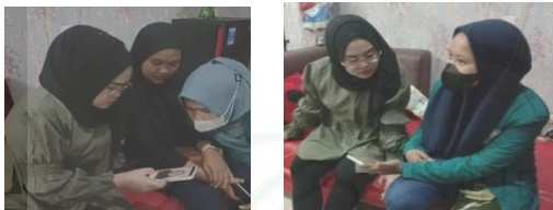
Gambar 5. MUA Menggunakan Aplikasi.

Tim melakukan pelatihan kepada MUA dengan terlebih dahulu menjelaskan cara penggunaan aplikasi lup scanner make up artist . Aplikasi lup scanner dapat digunakan tanpa memerlukan paket data. Penggunaan aplikasi dimulai dengan login pada aplikasi, pilih menu filter dan tentukan bentuk wajah melalui filter deteksi wajah, gunakan filter koreksi wajah untuk membantu MUA mengoreksi wajah konsumen, dan memilih riasan sesuai keinginan konsumen secara otomatis melalui filter atau manual melalui menu make up . Setelah mengenalkan langsung fitur pada aplikasi yang digunakan tim mengarahkan MUA untuk mencoba menggunakan aplikasi secara mandiri (Gambar 2.5) namun tetap dalam pantauan tim. Tujuan dilakukannya pelatihan adalah untuk membuat MUA mahir menggunakan aplikasi lup scanner make up artist .