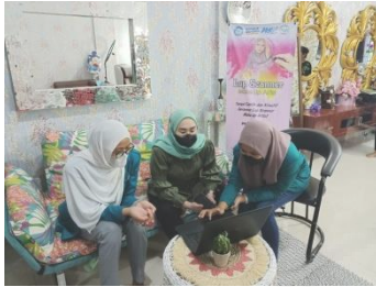
Gambar 4. Sosialisasi MUA.

memberikan buku pedoman penggunaan aplikasi untuk memudahkan MUA memahami cara kerja aplikasi yang telah dibuat.