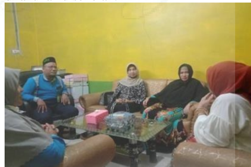
Gambar 3. -TOT

Pada tahap pertama (tahap persiapan) kegiatan ini merupakan pertemuan dosen dan mahasiswa sebanyak 5 orang dalam melakukan pengenalan dan perencanaan terhadap kegiatan pendampingan pembelajaran melalui mentoring yang akan dilakukan di sekolah.