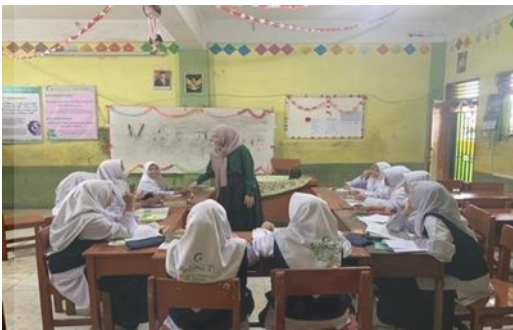
Gambar 4. Kunjungan Ke Sekolah

bahasa Interpersonal, Transrxctional, Short, dan Long Functional Texts , dengan menerapkan strategi yang bervariasi sehingga mahasiswa mentor terampil dalam membangun aktifkan siswa untuk meningkatkan kompetensi koginif, afektif, dan psikomototik mereka. Secara sistematis dan terstruktur mahasiswa dilatih untuk mahir menerapkan kegiatan mentoring melalui metode deliberate practice ini dengan baik.