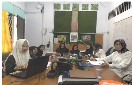
Gambar 2. Persiapan

Survei ini merupakan kombinasi berupa kualitas diri seorang mentor yang mencakupi kepercayaan diri, antusiasme, pengalaman, motivasi, komunikasi, dan lain- lain.