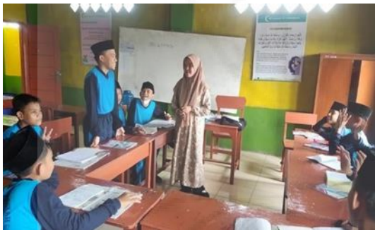
Gambar 5. Kegiatan Mentoring

Kegiatan di sekolah diawali dengan melakukan kunjungan dan pertemuan dengan Pimpinan sekolah serta dewan guru yang terlibat dalam pendampingn. Dalam kunjungan ini Kepala sekolah memberi arahan dan dukungan penuh terhadap tim kampus, yaitu 3 orang dosen dan 5 orang mahasiswa mentor.