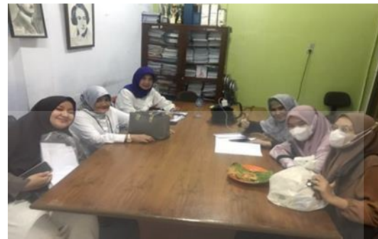
Gambar 6. Evaluasi Dan Refleksi

Pada kegiatan ini tim mentor dengan dibimbing oleh dosen melaksanakan pendampingan sesuai dengan Agenda yang telah ditetapkan, termasuk media maupun metode teknik yang digunakan. Seluruh tahapan dilaksanakan dengan mencatat setiap perkembangan danakejadian dalam Jurnal atau Log book masing-masing mentor untuk kemudian dijadikan bahan kajian dan refleksi. Melalui kegiatan ini, mahasiswa mentor membantu siswa utuk belajar dengan lebih sehingga dapat meningkatkan motivasi, percaya diri, kreativitas dan kolaborasi siswa. Kegiatan berlangsung selama 12 pertemuan dengan tetap dibimbing oleh dosen dan didampingi oleh guru.