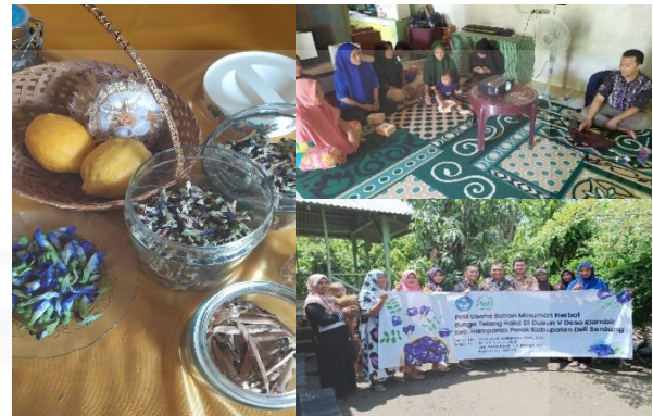
Gambar 4. Dokumentasi kegiatan PKM.

Dengan diberikannya pengetahuan dan pemahaman dalam melakukan pengeringan akan menjadi bekal bagi para mitra untuk membuat bahan herbal serta pengolahannya menjadi bahan minuman sehingga dapat dipasarkan ke masyarakat dan supermarket sehingga memberikan income generate bagi Mitra Unimed. Berikut ini dokumentasi kegiatan di lokasi mitra pada Gambar 4.