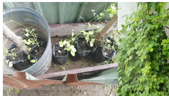
Gambar 1. Tanaman Bunga Telang.

dari penggunaan lahan yang berlokasi di depan dan belakang rumah warga. Lahan tersebut dijadikan sebagai tempat penanaman bunga telang. Lahan yang dipakai sebagai tempat tumbuhnya bunga telang yang berlokasi di depan dan belakang rumah warga (Gambar 1).