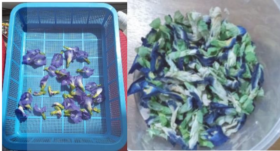
Gambar 2. Produk Bunga Telang.

lain memperbaiki kesehatan kulit dan penglihatan, sebagai sumber anti oksidan, menjaga kesehatan Jantung, anti kanker, anti diabetes, mengobati batuk dan infeksi tenggorokan. Adapun proses bunga telang yang diproduksi oleh kelompok mitra terlihat pada Gambar 2.