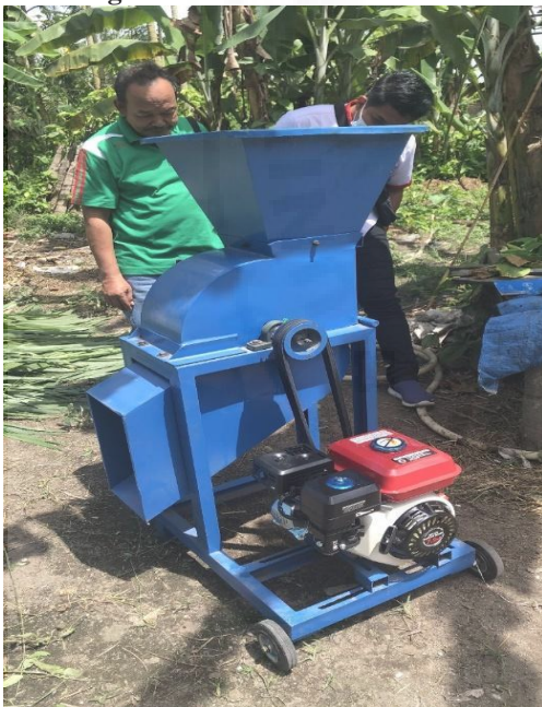
Gambar 2. Mesin Pencacah Rumput.