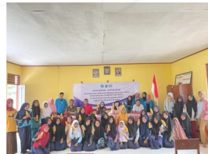
Gambar 6. Foto Bersama Remaja Putri

Minuman air kelapa-kunyit dibuat dengan mencampurkan 50 mg kunyit yang sdh d kupas ke dalam 250 ml air kelapa hijau. Kemudian diblender sampai kunyitnya halus dan tercampur dengan air kelapa hijau, kemudian disaring dan dimasukkan ke dalam botol yang berukuran 250 ml setelah dimasukkan kedalam botol kemudian dibagikan ke remaja putri dan siap untuk dikonsumsi.