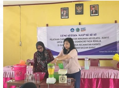
Gambar 4. Pembuatan Minuman Air Kelapa-Kunyit

Adapun alat dan bahan yang diperlukan adalah Air kelapa hijau, kunyit, blender, gelas takar, saringan, dan botol plastik.