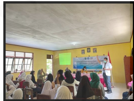
Gambar 1. Penyuluhan Kesehatan Reproduksi dan Dismenore