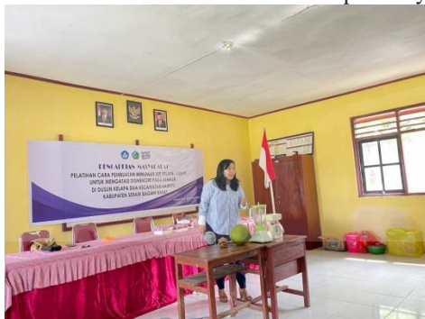
Gambar 3. Pengenalan Alat dan Bahan yang Dibutuhkan

Sebelum membuat produk minuman air kelapa-kunyit langkah pertama yang dilakukan adalah