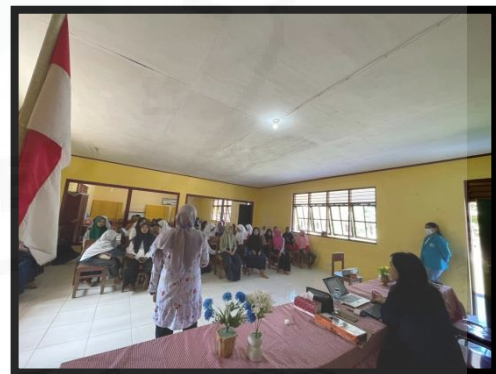
Gambar 2. Penyuluhan Tanaman Obat Tradisional

Sebelum melakukan pelatihan pembuatan produk minuman Air Kelapa-Kunyit, langkah awal yang dilakukan adalah memberikan penyuluhan tentang kesehatan reproduksi, dismenore, dan tanaman obat tradisional kepada remaja. Penyuluhan ini bertujuan untuk meningkatkan pemahaman remaja tentang kesehatan reproduksi, dismenore, dan tanaman obat tradisional. Dalam kegiatan penyuluhan dipaparkan tentang menstruasi, penyebab dismenore, pengobatan dismenore menggunakan farmakologi dan nonfarmakologi, kandungan yang terdapat dalam air kelapa hijau dan kunyit, serta cara mengolah dan membuat minuman air kelapa hijau-kunyit.