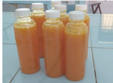
Gambar 5. Minuman Air Kelapa-Kunyit

Minuman air kelapa-kunyit dibuat dengan mencampurkan 50 mg kunyit yang sdh d kupas ke dalam 250 ml air kelapa hijau. Kemudian diblender sampai kunyitnya halus dan tercampur dengan air kelapa hijau, kemudian disaring dan dimasukkan ke dalam botol yang berukuran 250 ml setelah dimasukkan kedalam botol kemudian dibagikan ke remaja putri dan siap untuk dikonsumsi.