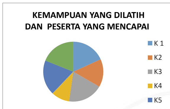
Gambar 3. Diagram Kemampuan yang Dilatih dan Peserta yang Mencapai.

Berdasarkan produk perangkat yang telah dikumpulkan, tampaknya peserta yang bersangkutan masih kesulitan dalam mengembangkan pertanyaan produktif. Hal ini yang masih menjadi catatan dan perlu dikembangkan lagi di masa yang akan datang. Temuan kegiatan ini memiliki relevansi dengan temuan Rapih & Sytaryadi (2018) bahwa persoalan utama yang sering dihadapi guru dalam pembelajaran HOTS adalah adalah perancangan dan penilaian pembelajaran yang berorientasi HOTS. Hal ini sangat penting karena penilaian merupakan salah satu aspek yang sangat berpengaruh dalam proses pembelajaran (Herwin & Phoon, 2019). Untuk itu perlu penekanan pada komponen tersebut di masa yang akan datang.