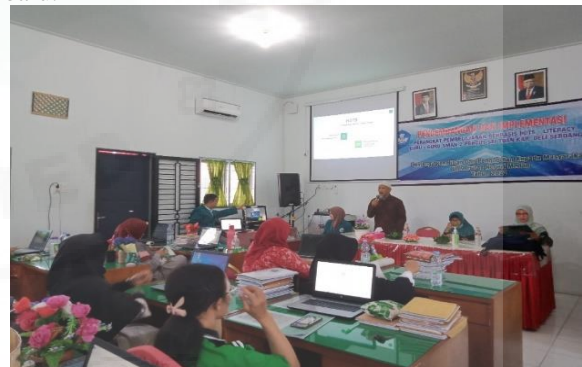
Gambar 1. Narasumber Pertama Sedang Menyampaikan Materi Mengenai Hots.

Order Thinking Skill ( HOTs ) atau Berpikir Tingkat Tinggi. Pada paparannya Narasumber secara garis besar menyampaikan pentingnya menumbuhkan atau mendorong siswa untuk melakukan berpikir tingkat tinggi melalui implementasi perangkat pembelajaran baik media pembelajaran, Lembar Kerja Peserta Didik (LKPD) maupun instrumen atau perangkat penilaian yang digunakan guru pada saat proses belajar mengajar (PBM). Kemampuan atau keterampilan berpikir tingkat tinggi merupakan kemampuan memberikan pemikiran yang kompleks dalam suatu proses kognitif. Berdasarkan kategori proses kognitif Bloom, berpikir tingkat tinggi meliputi 3 proses kognitif yaitu menganalisis, mengevaluasi dan mengkreasi (Anderson dan Krathwohl, 2001). Menganalisis merupakan kemampuan memecahkan materi ke dalam bagian-bagiannya dan menentukan keterhubungan antar bagian dan ke dalam suatu struktur atau keseluruhan. Adapun mengevaluasi merupakan kemampuan membuat pertimbangan berdasarkan suatu kriteria atau standar tertentu. Kemudian mengkreasi adalah kemampuan menempatkan unsur secara bersama untuk membentuk keseluruhan yg koheren atau fungsional atau menyusun kembali unsur ke dalam pola atau struktur baru.