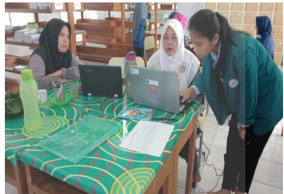
Gambar 5. Guru-Guru Kelompok Mapel Fisika Sedang Melakukan Praktek Pengembangan.