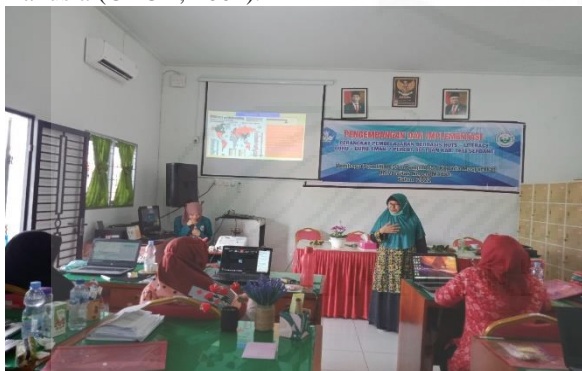
Gambar 2. Narasumber Kedua Sedang Menyampaikan Materi Literasi Dan Implementasi Hots-Literacy Pada Proses Pembelajaran.

Narasumber kedua juga menyampaikan informasi atau pengetahuan mengenai Literasi dan Implementasi HOTS-Literacy pada proses pembelajaran. Literasi dimaknai sebagai kemampuan dan keterampilan individu dalam membaca, menulis, berbicara, menghitung dan memecahkan masalah pada bidang atau aktivitas keahlian tertentu yang diperlukan dalam mengolah informasi dan pengetahuan untuk kecakapan hidup (kemdikbud, 2018). Sementara itu Literasi Sains diartikan sebagai kemampuan menggunakan pengetahuan sains, mengidentifikasi pertanyaan dan menarik kesimpulan berdasarkan bukti-bukti dalam rangka memahami serta membuat keputusan berkenaan dengan alam dan perubahan yang dilakukan terhadap alam melalui aktivitas manusia (OECD, 2004).