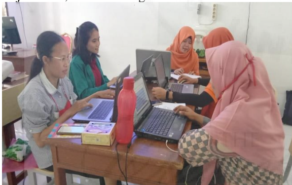
Gambar 3. Guru-Guru Kelompok Mapel Biologi Sedang Melakukan Praktek Pengembangan.

Kegiatan Pelatihan Praktek Pengembangan Perangkat Pembelajaran dilakukan dalam 4 pertemuan secara berturut-turut pada pertemuan 1, 2, 3 dan dilakukan praktek pengembangan; Rencana Pelaksanaan Pembelajaran (RPP), Media Pembelajaran, Lembar Kerja Peserta Didik (LKPD) dan Perangkat Penilaian yang sudah ada atau dimiliki guru menjadi Perangkat Pembelajaran Berbasis HOTs-Literacy . Masing-masing pelatihan ini dilakukan secara berkelompok sesuai dengan mata pelajarannya yang terdiri dari kelompok guru-guru mata pelajaran; Biologi, Kimia dan Fisika yang berturut-turut berjumlah 6, 4 dan 3 orang.