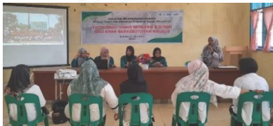
Gambar 2. Sosialisasi tim kepada guru

Sosialisasi dilakukan dengan memberikan gambaran umum wilayah Batubara, pengenalan media pembelajaran bencana banjir berbasis Bisindo, dan penjelasan Bahasa Isyarat Indonesia. Hasil yang didapatkan dari kegiatan sosialisasi, guru mendapatkan pemahaman yang lebih mendalam terkait penyebab banjir di SLB Negeri Batubara yaitu dikarenakan letaknya yang berada di dataran rendah, mengenal bentuk visual media sains berbasis Bisindo, dan lebih memahami penggunaan Bisindo (Gambar 2).