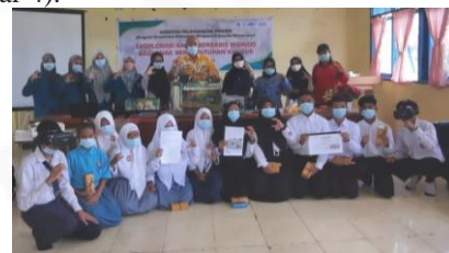
Gambar 4. Monitoring dan evaluasi penerapan media pembelajaran berbasis Bisindo terhadap siswa tunarungu

Hasil monitoring yang dilakukan tim pelaksana diperoleh bahwa guru dan siswa dalam menggunakan media pembelajaran banjir berbasis Bisindo. Siswa tunarungu mampu menyampaikan kembali materi yang telah disampaikan guru dan dapat menjawab pertanyaan yang diberikan oleh guru melalui bahasa Isyarat Indonesia. Keberhasilan kegiatan peningkatan edukasi guru berbasis Bisindo dapat dilihat dari antusias siswa dan guru ketika sedang dalam kegiatan belajar mengajar menggunakan media pembelajaran banjir berbasis Bisindo. Siswa tunarungu dapat memahami materi bencana alam dan megalami peningkatan pada aspek interaktif, efisien dan responsive yang menunjukkan bahwa media pembelajaran berbasis Bisindo berpotensi merangsang minat belajar siswa tunarungu (Gambar 4).