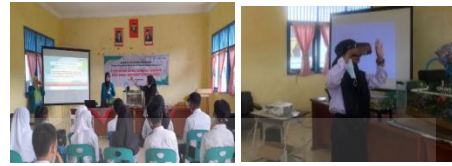
Gambar 3. Pelatihan penggunaan media pembelajaran berbasis Bisindo dan kacamata virtual reality

Melalui kegiatan pelatihan yang dilakukan, guru dapat menyampaikan materi bencana banjir dan mengoperasikan media pembelajaran banjir berbasis Bisindo dan kacamata virtual reality serta dapat menerapkannya dalam pembelajaran siswa tunarungu dengan menggunakan komunikasi Bahasa Isyarat Indonesia (Gambar 3).