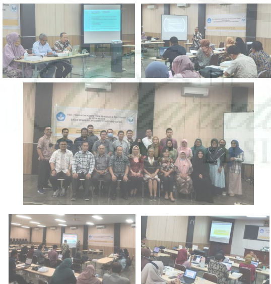
Gambar 2. Pelaksanaan Pelatihan Penyusunan Proposal PPPTV-PTS Model ADDIE

Materi pelatihan meliputi : (1) Hari Pertama (16 Juni 2022) : Kebijakan MBKM : Competitive Fund, Best Practice Program Hibah Kompetisi Institusi 2002-2022, Overview Strategic Planning dan Paradigma Penguatan Pendidikan Tinggi Vokasi, Evaluasi Diri Sebagai Dasar Pengembangan Program dan Kegiatan Competitive Fund , SWOT Analysis , Penyusunan Program, Kegiatan dan Indikator Kinerja Utama. Pada hari pertama kegiatan, diikuti oleh 25 peserta dari 10 Politeknik PTS di Kota Medan dan juga dihadiri oleh staf administrasi LPPM Unimed dengan tugas untuk memastikan keterlaksanaan Program Kemitraan Masyarakat dan terkait pertanggungjawaban administrasi dan keuangan; (2) Hari Kedua (17 Juni 2022) materinya meliputi : Review dan penyamaan persepsi Panduan Penyusunan Proposal PPPTV-PTS Tahun 2022, dan Tata cara pengusulan Proposal PPPTV-PTS 2022; (3) Hari Ketiga dan Keempat (23-24 Juni 2022) agenda pelatihan adalah pendampingan intensif penyusunan proposal PPPTV-PTS, Bab 1 - Bab 4 dan Lampiran. Kegiatan dilanjutkan dengan kerja mandiri peserta pelatihan di kampus masing-masing dan konsultasi peserta pelatihan kepada Tim PKM dengan koordinasi dan jadwal yang disepakati.