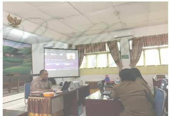
Gambar 3. Tim PkM melakukan pendampingan Pembuatan Video Tutorial Pembelajaran