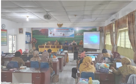
Gambar 4. Tim PkM dan Guru SMAN 5 Binjai melakukan Sharing Session

perguruan tinggi, disamping itu kegiatan ini juga merupakan panggilan untuk membantu dan menyebarkan pengetahuan mengenai pembuatan video pembelajaran di sekolah, semoga kedepannya kegiatan ini menambah motivasi untuk guru dalam berkreasi membuat video pembelajaran.”