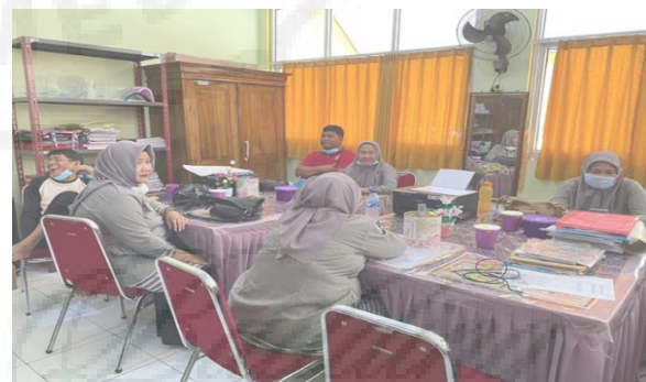
Gambar 1. Suasana Ruang Guru SDN Adiarsabarot IV.

Terbatas (PTMT) membawa angin segar bagi Pendidikan yang ada di karawang, semua jam belajar di sekolah dibatasi dan sisanya siswa belajar di rumah. Tentunya, pada pelaksanaan PTMT ini guru perlu berinovasi agar tujuan pembelajaran tercapai. Dalam proses pembelajaran diperlukan sebuah model serta media pembelajaran yang dapat mendukung aktivitas belajar (Diyantari et al., 2020; Rosdiana et al., 2013; Widiatmika et al., 2017). Hal ini bertujuan agar tujuan pembelajaran dan pendidikan dapat tercapai dengan maksimal. Dalam pelaksanaan pembelajaran para guru membutuhkan bahan ajar yang disesuaikan dengan karakteristik serta kebutuhan siswa yang nantinya akan membantu siswa dalam belajar (Asriani et al., 2017; Fadillah & Jamilah, 2016; Purnomo & Wilujeng, 2016). Penggunaan bahan ajar ini akan membantu proses pembelajaran. Bahan ajar yang baik sesuai dengan tujuan pembelajaran, menggunakan bahasa yang mudah dipahami oleh siswa, dan sesuai dengan perkembangan anak (Fadillah & Jamilah, 2016; Purnomo & Wilujeng, 2016). Namun kenyataannya, Guru di SDN Adiarsabarot IV karawang kesulitan dalam pelaksanaan pembelajaran. Guru masih belum menemukan bahan ajar yang tepat untuk siswanya belajar di kelas maupun di rumah, karena selama ini guru masih menggunakan buku teks sehingga pembelajaran terkesan tidak fleksibel dengan situasi pembelajaran saat ini.