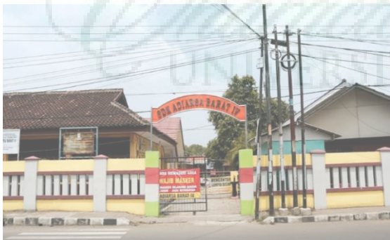
Gambar 2. Lokasi SDN Adiarsa Barat IV di tengah Kota

Dilihat dari lokasinya, SDN Adiarsabarot IV berada di Jl. Wirasaba No.95, Adiarsa Timur. Kecamatan Karawang Timur. Kabupaten Karawang. Sekolah ini terletak di tengah kota dan berada di jalan utama kabupaten karawang, yang seharusnya menjadi sekolah terdepan dan percontohan bagi sekolah-sekolah lain, namun system pembelajarannya masih belum mengikuti perkembangan pembangunan di sekitarnya.