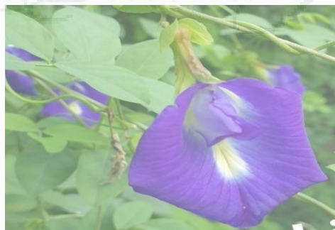
Gambar1. Bunga Telang

Bunga telang merupakan salah satu tumbuhan yang sangat mudah ditemui di Indonesia. Tanaman ini cukup populer karena manfaatnya yang sangat berguna untuk kesehatan. Golongan bunga telang termasuk ke dalam keluarga polong-polongan atau Fabacea yang berasal dari Asia Tenggara. Bunga dengan nama latin Clitoria Ternatea memiliki bentuk seperti semak yang bisa tumbuh hingga panjang 3-5 meter, dengan daun hijau berbentuk lonjong, dan memiliki bunga menyerupai corong berwarna ungu (Santoso, 2021:8-10).