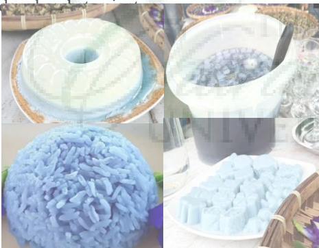
Gambar 4. Produk olahan berbahan bunga telang

Produk olahan berbahan dasar bunga telang juga menjadi fokus dalam kegiatan ini. Variasi produk akan memberikan nilai tambah pada penjualan serta manfaat bunga telang dengan mengkonsumsi rutin sehari-hari. Beberapa produk olahan dengan memanfaatkan warna biru pada bunga telang membuat produk makanan menjadi lebih unik dan menarik bahkan memberikan khasiat buat kesehatan seperti membantu menurunkan berat badan.