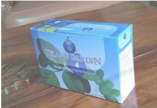
Gambar 3. Kemasan Bunga Telang

Bentuk kotak pada kemasan memberi kesan elegan dan tidak terlihat murahan sehingga dapat memengaruhi harga yang akan ditetapkan. Visualisasi bunga Telang pada kemasan mengedukasi konsumen yang belum pernah melihat bentuk fisik telang yang sebenarnya. Komposisi warna biru keunguan merepresentasikan warna produk teh telang yang berwarna ungu pekat setelah diseduh dengan menggunakan air panas. Kemasan juga memuat cara penyajian sederhana untuk membuat teh telang serta khasiat yang didapatkan setelah mengkonsumsi secara teratur. Produk didalam kotak juga menggunakan plastik yang memiliki seal pengunci untuk menjadi kualitas produk agar tahan lebih lama dikonsumsi.