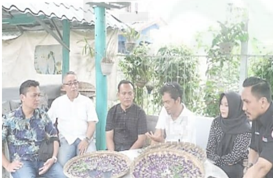
Gambar 2. Diskusi dengan Mitra Usaha

Berbagai kendala yang dihadapi oleh mitra terkait pemasaran dan penjualan didiskusikan bersama dengan Tim PKM Unimed. Permasalahan tersebut kemudian dirangkum dan dirumuskan untuk diberikan solusi yang efektif dalam pemecahannya.