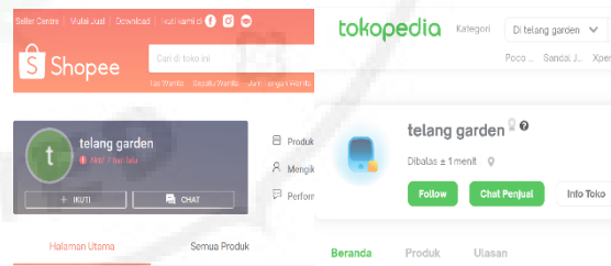
Gambar 5. E-Commerce Telang Garden

Tokopedia dan Shopee menjadi pilihan sebagai saluran penjualan. Pasar yang potensial dengan banyaknya jumlah pengguna kedua aplikasi menjadi motivasi pemanfaatan e-commerce sebagai sistem penjualan. Merek Telang Garden menjadi nama toko online yang berkaitan dengan pemanfaatan media sosial dengan nama yang sama.