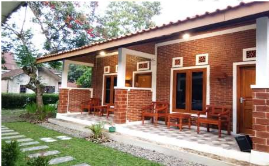
Gambar 7. Tempat Penginapan di Sekitar Air Bah Damanik (2°51'40'' LU dan 98°56'41''BT)

penginapan bernama Tea Garden Inn . Setiap kamar memiliki daya tampung dua orang dan setiap kamar dilengkapi berbagai fasilitas yang sederhana berupa kipas angin, tempat tidur, lemari pakaian dan kursi satu set. Harga setiap penginapan bervariasi mulai dari Rp. 150.000 – Rp. 250.000/malam. Sehingga untuk indikator untuk tempat penginapan diberi skor 3. Untuk lebih jelas dapat dilihat pada gambar 7.