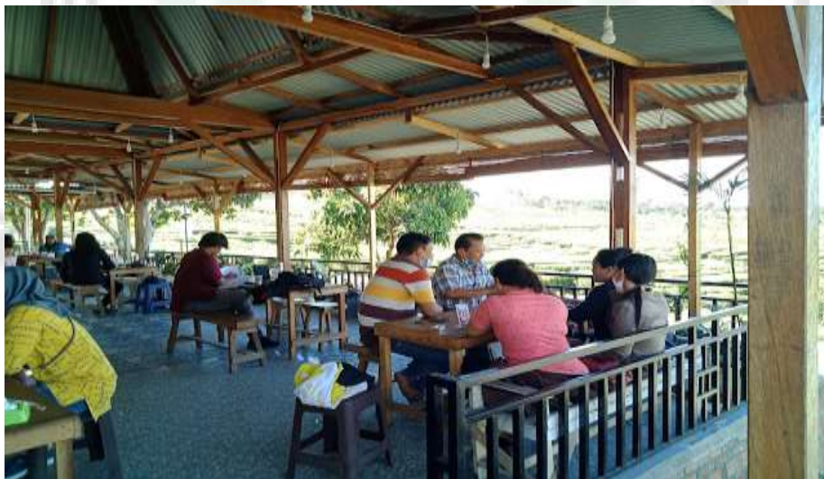
Gambar 8. Rumah Makan di Sekitar Objek Wisata Air Bah Damanik (2°51'45'' LU dan 98°56'21''BT)

rumah makan juga sangat berpengaruh dan menentukan dalam pengembangan objek wisata, rumah makan akan menyediakan kebutuhan para pengunjung berupa makanan dan minuman. Dari hasil penelitian objek wisata Pemandian Alam Bah Damanik ada 2 unit rumah makan terdekat yang tersedia. Rumah makan menawarkan harga yang bervariasi antara Rp.15.000-Rp. 20.000/porsi dan minuman dengan harga Rp. 4.000-Rp. 10.000. sehingga untuk indikator untuk rumah makan diberi skor 2. Untuk lebih jelas dapat dilihat pada gambar 8.