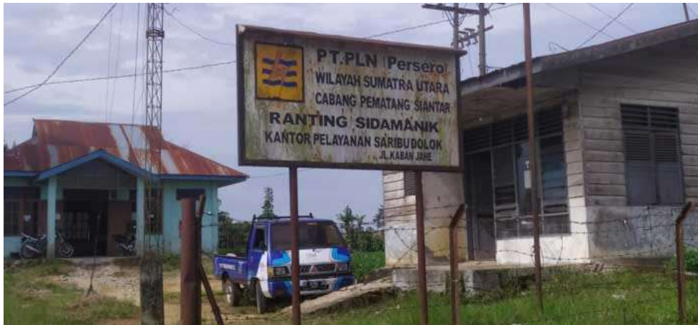
Gambar 13. Jaringan Listrik di Sekitar Air Bah Damanik (2°51'10'' LU dan 98°56'19''BT)