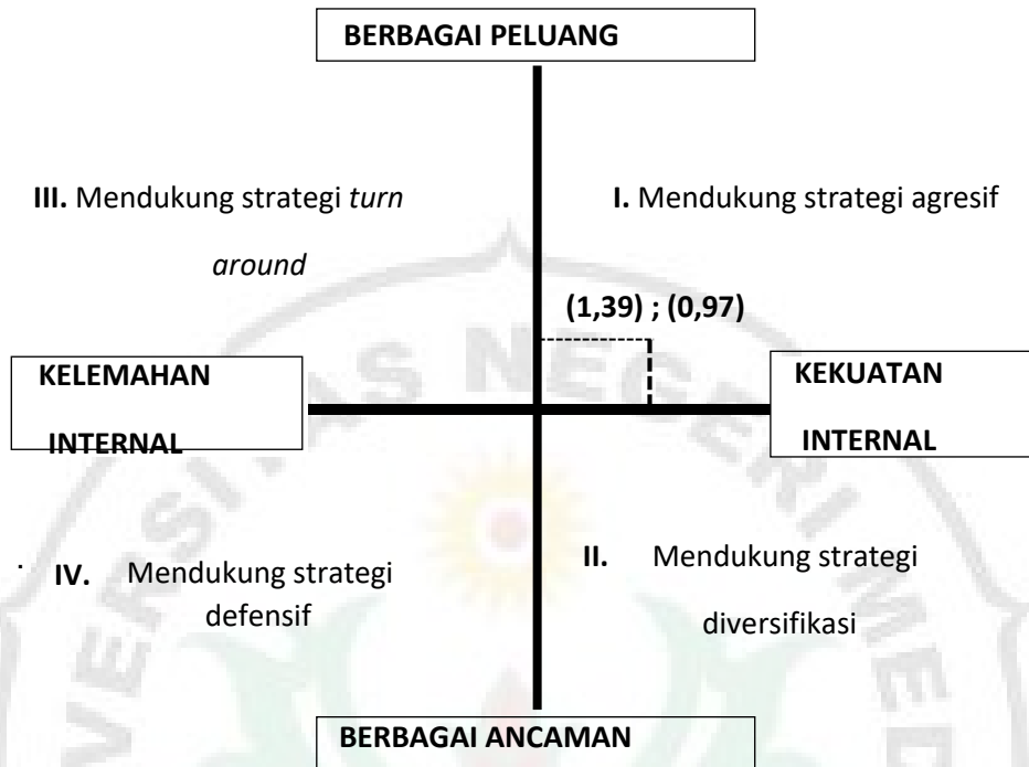
Gambar 15. Diagram Analisis SWOT

Berdasarkan gambar 15 pada diagram SWOT diatas menunjukkan bahwa titik potong berada pada kuadran I, yang mana situasi tersebut menunjukkan bahwa titik potong berada pada kuadran I, yang mana situasi tersebut dapat dilakukan dengan memanfaatkan seluruh kekuatan dan peluang (SO) yakni strategi ini dibuat berdasarkan jalan pikiran perusahaan, yaitu dengan memanfaatkan peluang sebesar-besarnya agar dapat meningkatkan pertumbuhan objek wisata Pemandian Alam Bah Damanik. Memanfaatkan kekuatan yang ada seperti : Memiliki topografi yang bervariasi dan memiliki relief dataran tinggi, Kualitas Air jernih dan bersih, Kondisi akses jalan yang sudah beraspal dan mudah dilalui, Memiliki penginapan yang sangat memadai serta Suasana objek wisata yang sejuk dan memberi kenyamanan.