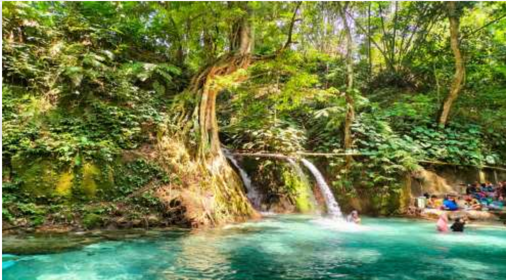
Gambar 6. Penampakan Sumber Mata Air Bah Damanik (2°50'46'' LU dan 98°50'41''BT)

Berdasarkan gambar 5, Pemandian Alam Bah Damanik dilihat secara fisik menggunakan indra pengelihatan yang diamati dari segi warna tampak air sangat jernih, dan berwarna bening sedangkan dari rasa Air Bah Damanik berasa tawar. Kelebihan air pemandian ini memiliki tingkat kejernihan air yang berbeda yang mana air yang berwarna kebiru-biruan jika dilihat dari dasar air. Selain itu, Pemandian Alam Bah Damanik memiliki suhu yang dingin serta menyejukkan.