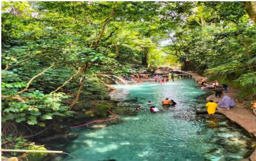
Gambar 4. Vegetasi di Sekitar Pemandian Alam Bah Damanik (2°51'57" LU dan 98°54'49" BT)

Berdasarkan pengamatan yang dilakukan, jenis vegetasi yang terdapat di Pemandian Alam Bah Damanik lebih mendominasi terhadap tanaman pertanian yang dibudidayakan masyarakat sebagai mata pencaharian dalam memenuhi kebutuhan sehari-hari. Jenis vegetasi tersebut diantaranya padi yang ditanam masyarakat, dan ini terbentang luas di sekitaran objek wisata. Vegetasi lain yang cukup mendominasi juga ialah tanaman kopi sedangkan vegetasi lain, hanya sebagian dan tidak terlalu mendominasi seperti tanaman bonsai beringin, kelapa, coklat, pisang, dan pinang, serta tidak ada vegetasi yang mencirikan objek wisata ini. Sehingga untuk indikator vegetasi diberi skor 2.