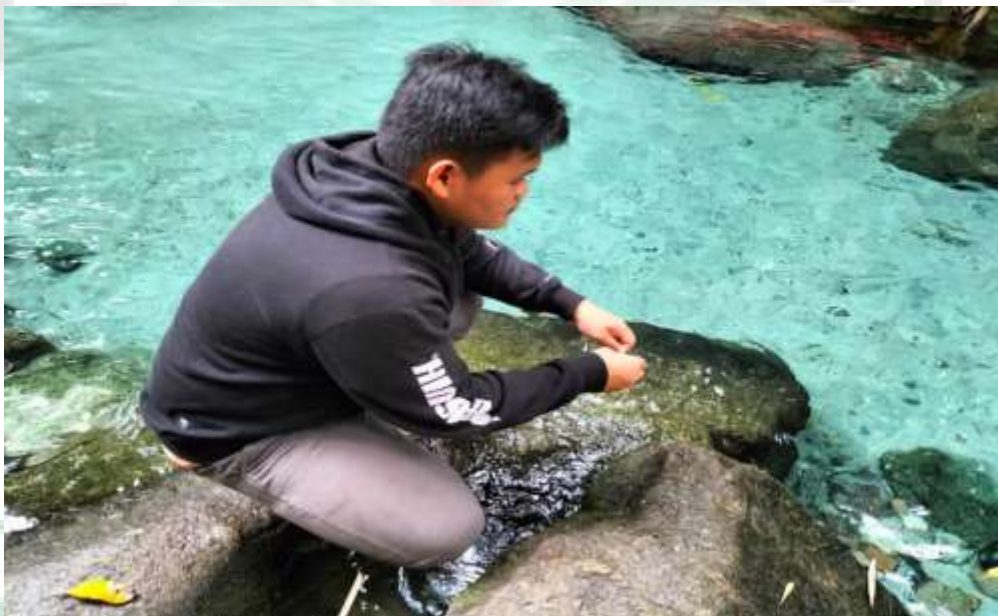
Gambar 5. Kondisi Air Bah Damanik ( 2^{\circ}50'51'' LU dan 98^{\circ}50'44'' BT)

Kondisi air menentukan ada tidaknya suatu wilayah yang dapat dihuni dengan baik. Air yang bersumber dari mata air tanah seperti mata air memiliki kualitas air yang bersih, tidak berasa, dan tidak berbau bagi pengunjung. Dari hasil observasi penelitian yang dilakukan Pemandian Alam Bah Damanik menunjukkan bahwa air yang ada di objek wisata ini bersumber dari mata air, jernih, tidak berbau dan tidak berasa. Berdasarkan pengukuran suhu air di Pemandian Alam Bah Damanik memiliki suhu diantara 11^{\circ}\text{C} - 15^{\circ}\text{C} Sehingga untuk indikator air diberi skor 3.