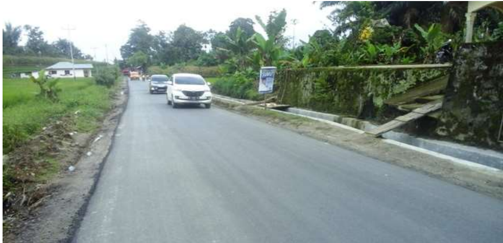
Gambar 12. Jaringan Jalan Menuju Objek Wisata Air Bah Damanik (2°51'47'' LU dan 98°56'48''BT)