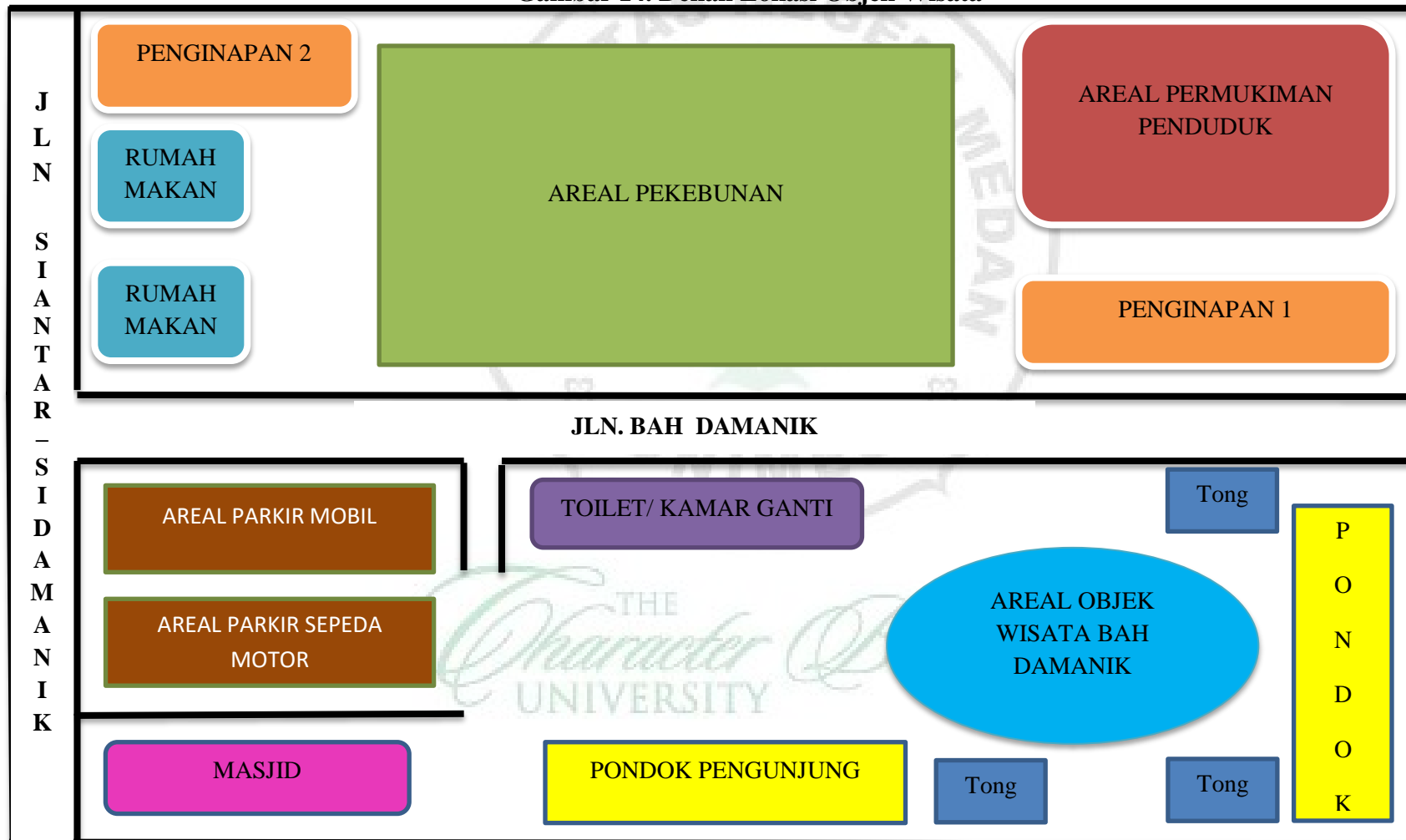
Gambar 14. Denah Lokasi Objek Wisata