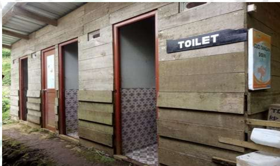
Gambar 9. WC Umum di Sekitar Objek Wisata Air Bah Damanik (2°51'06'' LU dan 98°56'11''BT)

WC umum dikatakan layak di objek wisata apabila WC umum terdapat di tempat yang mudah dijangkau oleh pengunjung, lantai terbuat dari semen atau keramik, atap dari seng, kondisi WC umum bersih dan terawat sehingga merasa nyaman selama menggunakan WC umum. Dari hasil penelitian keadaan WC umum di objek wisata Pemandian Alam Bah Damanik dekat dengan lokasi. Berada disatu tempat yang terdiri dari 3 pintu. Menggunakan tong/ember sebagai tempat penampungan air. Kondisi setiap ruangan bersih dan sumber air yang tersedia memadai. Untuk pengunjung yang menggunakan WC umum diberikan secara gratis. Sehingga untuk indikator WC umum diberi skor 3. Untuk lebih jelas dapat dilihat pada gambar 9.