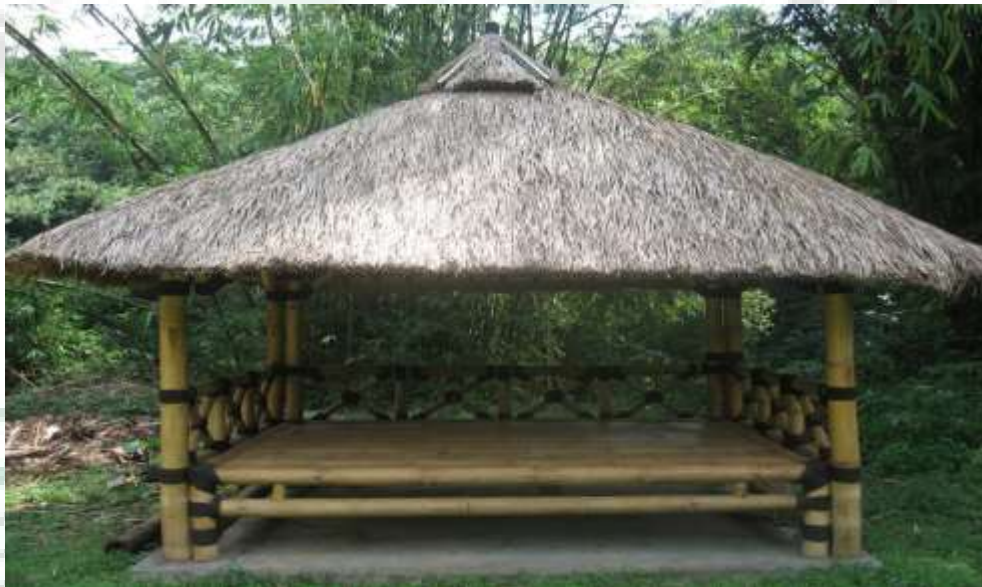
Gambar 10. Pondok Pengunjung Objek Wisata Air Bah Damanik (2°51'20'' LU dan 98°56'51''BT)

Pondok pengunjung merupakan sarana pariwisata yang diperlukan oleh pengunjung yang berfungsi sebagai tempat berlindung pengunjung apabila datang ke suatu objek wisata. Dari hasil penelitian yang dilakukan di objek wisata Pemandian Alam Bah Damanik, tersedia pondok pengunjung salam jumlah yang memadai dan tersebar di berbagai tempat di sekitar objek wisata. Pondok pengunjung berlantaikan papan yang dilapisi tikar, tiang penyanggah terbuat dari papan balok, dan beratapkan seng. Pondok pengunjung mampu menampung 2-6 orang pengunjung. Sehingga untuk indikator pondok pengunjung diberi skor 2. Untuk lebih jelas dapat dilihat pada gambar 10.