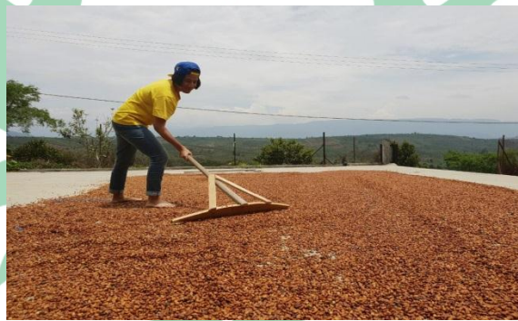
Gambar 1.1 Penjemuran kopi secara Tradisional

Penjemuran kopi secara natural merupakan metode yang dinilai kurang efektif, karena penjemuran ini memakan waktu yang relatif lama dan hanya menggunakan energi dari matahari sebagai sumber panas.