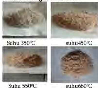
Gambar 1. Pengujian Zeolit dengan variasi suhu

Gambar hasil Zeolit dengan variasi suhu 350°C, 450°C, 550°C dan 650°C menunjukkan warna yang berbeda-beda. Hal ini diakibatkan dengan variasi suhu yang berbeda-beda. Zeolit dengan variasi suhu 350°C berwarna putih. Dan zeolit dengan variasi suhu 450°C, 550°C berwarna kecoklatan, sedangkan zeolit dengan variasi suhu 650°C warnanya kemerah-merahan. Kalsinasi dan variasi suhu zeolit mempengaruhi kualitas zeolit yang dihasilkan (sirait, 2012).