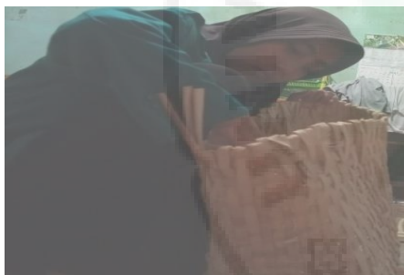
Gambar 1. Proses Pembuatan Tas dari bahan pelepah Sawit