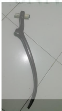
Gambar 8. Pemasangan botol roll on .