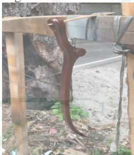
Gambar 7. Penjemuran