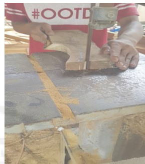
Gambar 2. Pemotongan Kayu