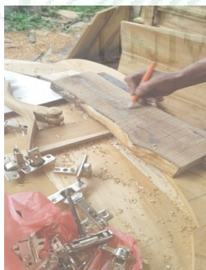
Gambar 1. Design Produk