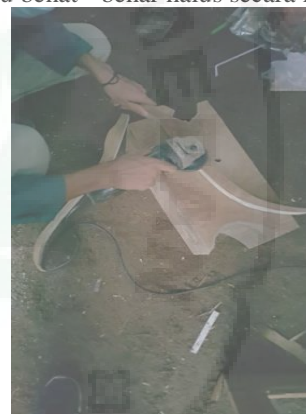
Gambar 3. Penghalusan Kayu