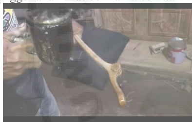
Gambar 6. Pengecatan