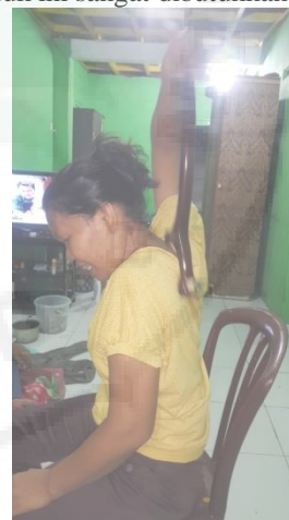
Gambar 9. Penggunaan produk

Kegiatan ini melibatkan 3-4 orang tua yang dilakukan di Kecamatan Percut Sei Tuan, Kabupaten Deli Serdang, Sumatera Utara pada bulan Juli 2021. Tujuan dari kegiatan ini sendiri adalah untuk menyelesaikan permasalahan yang sering dihadapi para orang tua terkait dengan melakukan pemijatan dan pengolesan balsem atau minyak urut ke punggung secara individu. Adapun keunggulan dari komoditas ini yaitu produk ini memiliki manfaat ganda yang dapat membantu mengatasi satu masalah hanya dengan menggunakan produk ini. Cara penggunaan produk ini juga sangat praktis dan tidak menimbulkan efek samping yang berbahaya karena alat ini aman untuk digunakan oleh siapa saja. Dengan adanya alat ini dapat mempermudah siapa saja untuk mengoleskan balsem jenis roll on dan melakukan pijatan apalagi saat keadaan Covid-19 ini dimana interaksi antar orang dibatasi, sehingga produk ini sangat dibutuhkan.