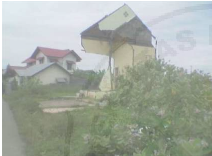
(a) Gambar Akibat Gempa Bumi

bumi, dampaknya bagi makhluk hidup dan lingkungan; dan 2). Siswa dibagi dalam 3 atau 4 kelompok yang berjumlah 4 atau 5 orang, kemudian diberikan penjelasan tentang permainan engklek untuk dimainkan (saat memainkan permainan diselingi dengan musik) dapat dilihat pada Gambar 2 (c).