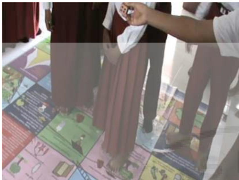
(a) Permainan Ular Tangga