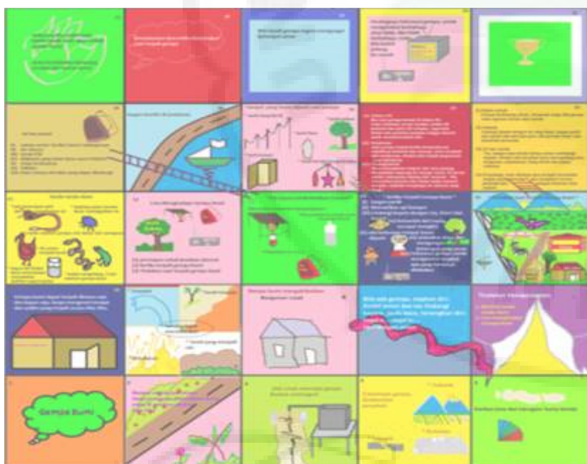
(b) Permainan Ular Tangga