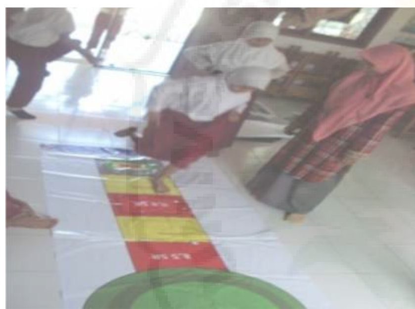
(b) Permainan Engklek