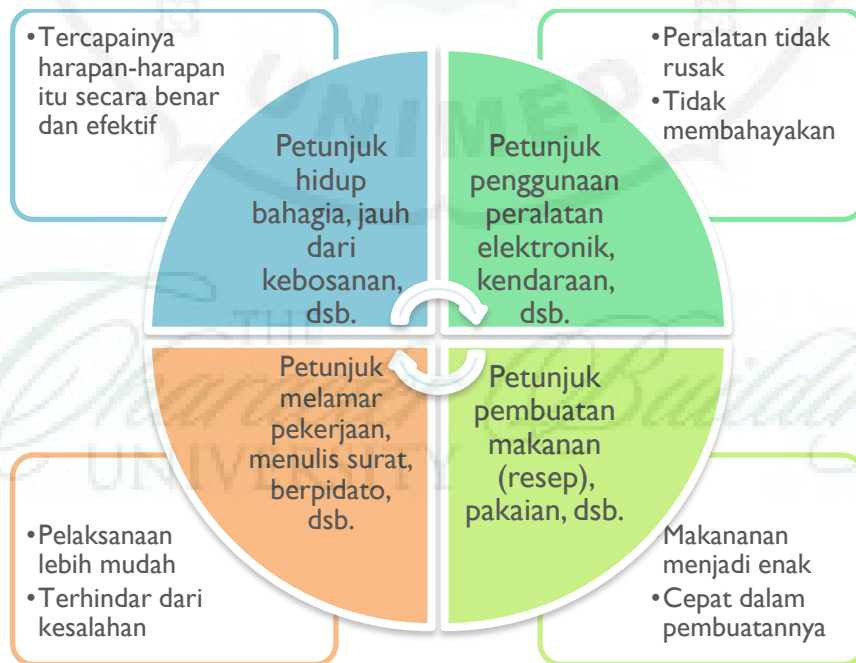
Gambar 2 Bentuk-bentuk Teks Memerintah (Prosedur)

Teks yang bersifat memerintah ( instructing ) cukup beragam bentuknya, yakni mulai dari yang sangat kompleks sampai pada yang sederhana, seperti petunjuk penggunaan alat. Berikut bentuk-bentuk teks petunjuk.