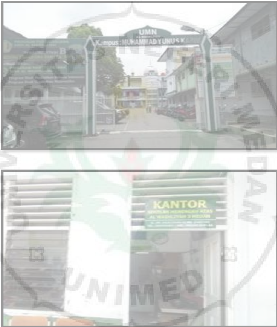
Gambar 10. Tampak Depan SMA Swasta Al-Washliyah 3 Medan

Adapun gambar peta lokasi sekolah dan struktur organisasi SMA Swasta