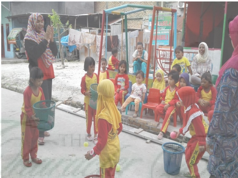
Anak melempar dan menangkap bola kedalam keranjang