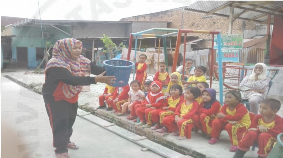
Peneliti menjelaskan langkah – langkah kegiatan bermain bola