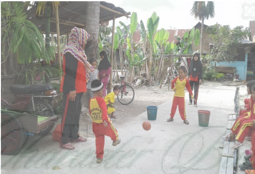
Anak menendang dan menangkap Bola