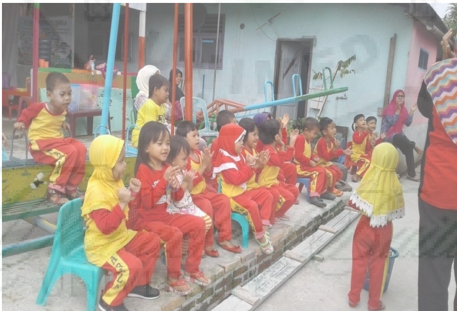
Anak – anak memberikan motivasi kepada temannya