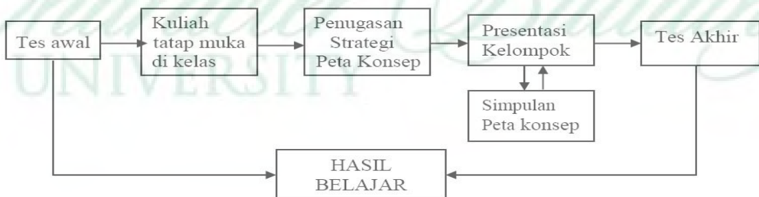
Gambar 2. Disain pembelajaran Rangkaian Listrik dengan strategi peta konsep

Setelah beberapa satuan unit perkuliahan disajikan maka dilakukan tes formatif. Analisis capaian hasil belajar mahasiswa dijadikan sebagai masukan untuk perbaikan pada perkuliahan berikutnya. Pada pertemuan terakhir akan dilakukan tes final sekaligus mengetahui capaian hasil belajar mahasiswa yang dikembangkan dengan strategi peta konsep. Proses pembelajaran dengan model penerapan strategi peta konsep ini dinyatakan seperti gambar berikut.