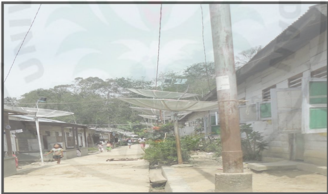
Gambar 17. Daerah Relokasi Sudah Memakai Listrik Tahun 2013

ada tanda-tanda akan adanya bantuan pemerintah akan listrik, maka masyarakat pun berinisiatif untuk memasang listrik secara pribadi. Beberapa masyarakat yang memasang listrik, dengan kesediaan menerima masyarakat lain yang ingin menyambung arus karena belum mampu memasukkan listrik. Hingga saat ini di daerah relokasi berdasarkan hasil penelitian mayoritas sudah menggunakan PLN walaupun hanya menyambung arus dengan tetangga yang sudah memakai listrik. Untuk melihat rumah di daerah relokasi sudah memakai listrik dapat dilihat pada gambar 17 :