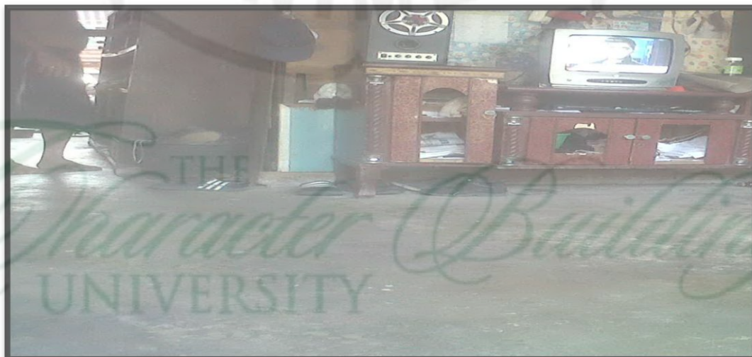
Gambar 9. Kondisi Lantai Rumah Salah Satu Responden Tahun 2013

Hasil penelitian menunjukkan bahwa seluruh (100%) lantai rumah responden telah diplester/diperkeras. Untuk lebih jelasnya lihat pada gambar 9 :