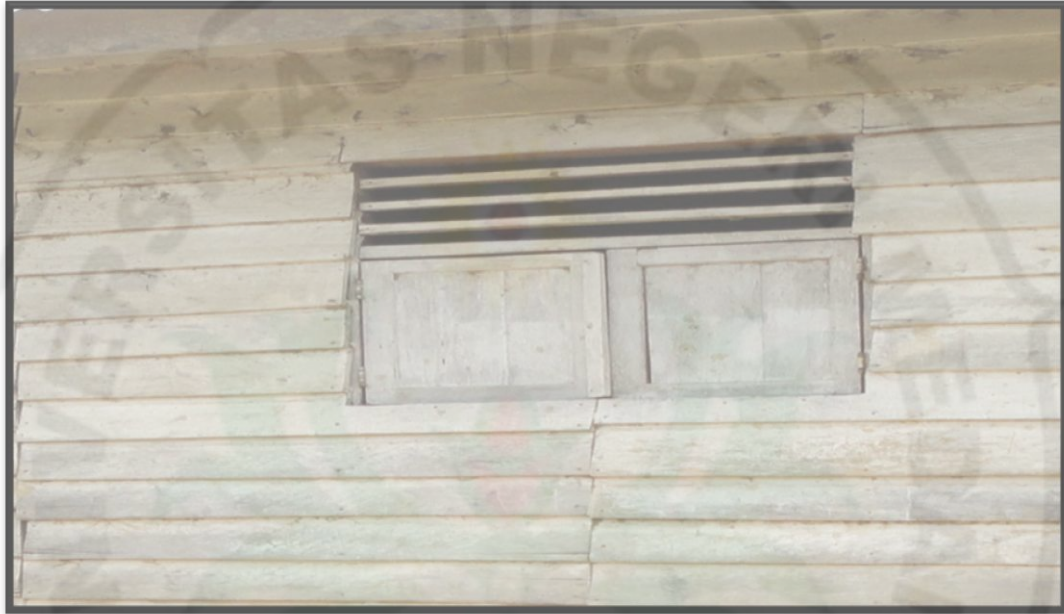
Gambar 11. Jendela Sisi Kiri Rumah Responden di Daerah Relokasi Tahun 2013

memiliki jendela yang berukuran kecil yang letaknya di sisi kiri rumah responden seperti gambar 11 :