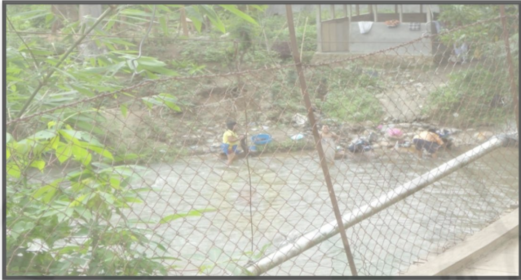
Gambar 16. Sungai di Daerah Relokasi Tahun 2013

Sungai yang terletak di pinggir permukiman warga relokasi merupakan sungai Batang Gadis, yang dipakai masyarakat sehari-hari. Selain karena kondisi Mck yang tidak memadai, kebiasaan masyarakat menggunakan sungai untuk semua keperluan merupakan tradisi di Kecamatan Muara Sipongi maupun Kecamatan Kotanopan, karena sungai mengalir di sepanjang permukiman penduduk. Banyaknya MCK yang rusak menyebabkan masyarakat beralih menggunakan sungai yang berada di dekat permukiman yang digunakan untuk mandi, mengambil air bersih bahkan menyuci.