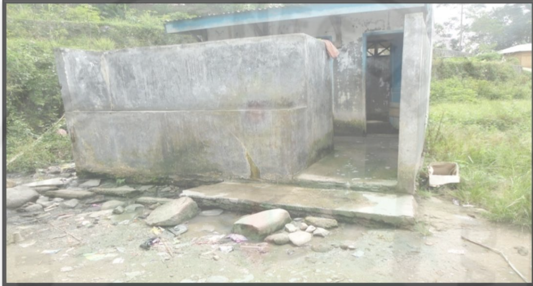
Gambar 14. MCK yang Berada di Daerah Relokasi Tahun 2013

yang paling banyak jumlah rumah. MCK yang masih digunakan masyarakat terdapat 3 unit. Untuk melihat kondisi MCK, dapat dilihat pada gambar 14 :