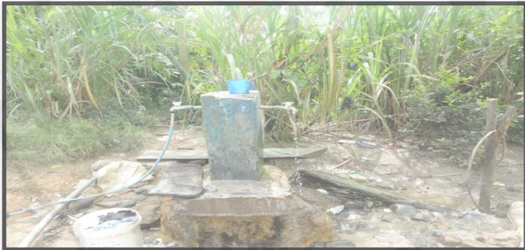
Gambar 15. Sumber Air yang Berada di Daerah Relokasi Tahun 2013

Mck yang tidak ada airnya biasanya masih dipakai masyarakat dengan mengambil air dari sumber air yang baru di bangun pemerintah seperti gambar 15: