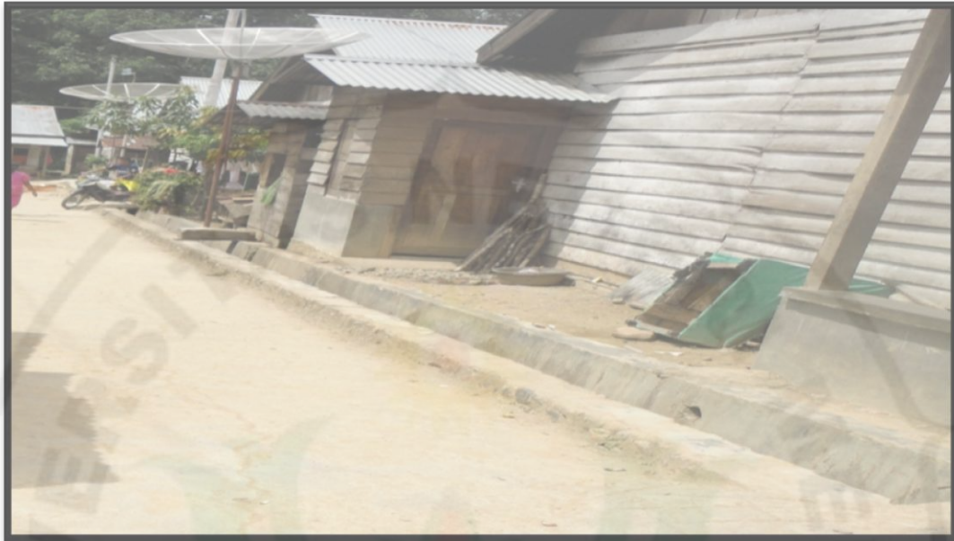
Gambar 12. Drainase yang Ada Di Daerah Relokasi Tahun 2013

Berdasarkan gambar 12 terlihat bahwa di daerah relokasi dilengkapi dengan parit yang ada berguna untuk menampung air hujan agar tidak ada genangan.