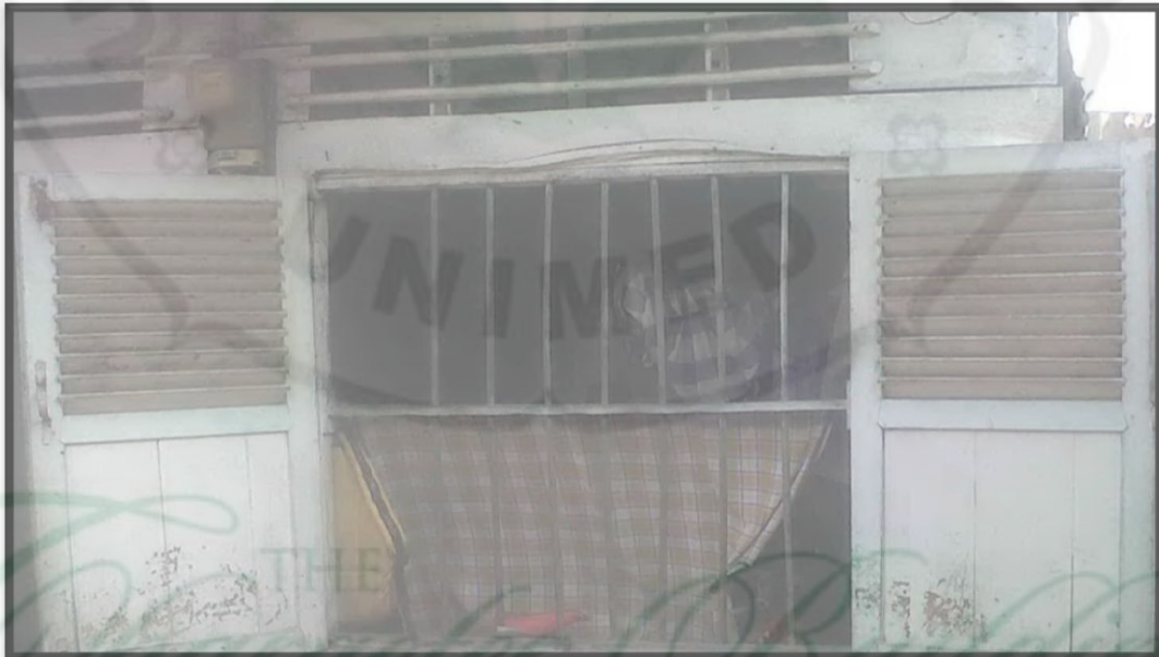
Gambar 10. Salah Satu Jendela Sisi Kanan Rumah Responden di Daerah Relokasi Tahun 2013

Hasil penelitian menunjukkan bahwa ventilasi rumah responden seluruhnya (100%) memiliki jendela di kedua sisi ruang. Hal ini disebabkan karena rumah relokasi pada saat diserahkan kepada masyarakat penerima bantuan rumah, kondisinya memiliki ventilasi dengan memiliki jendela di kedua sisi ruang. Untuk lebih jelasnya dapat dilihat pada gambar 10 :