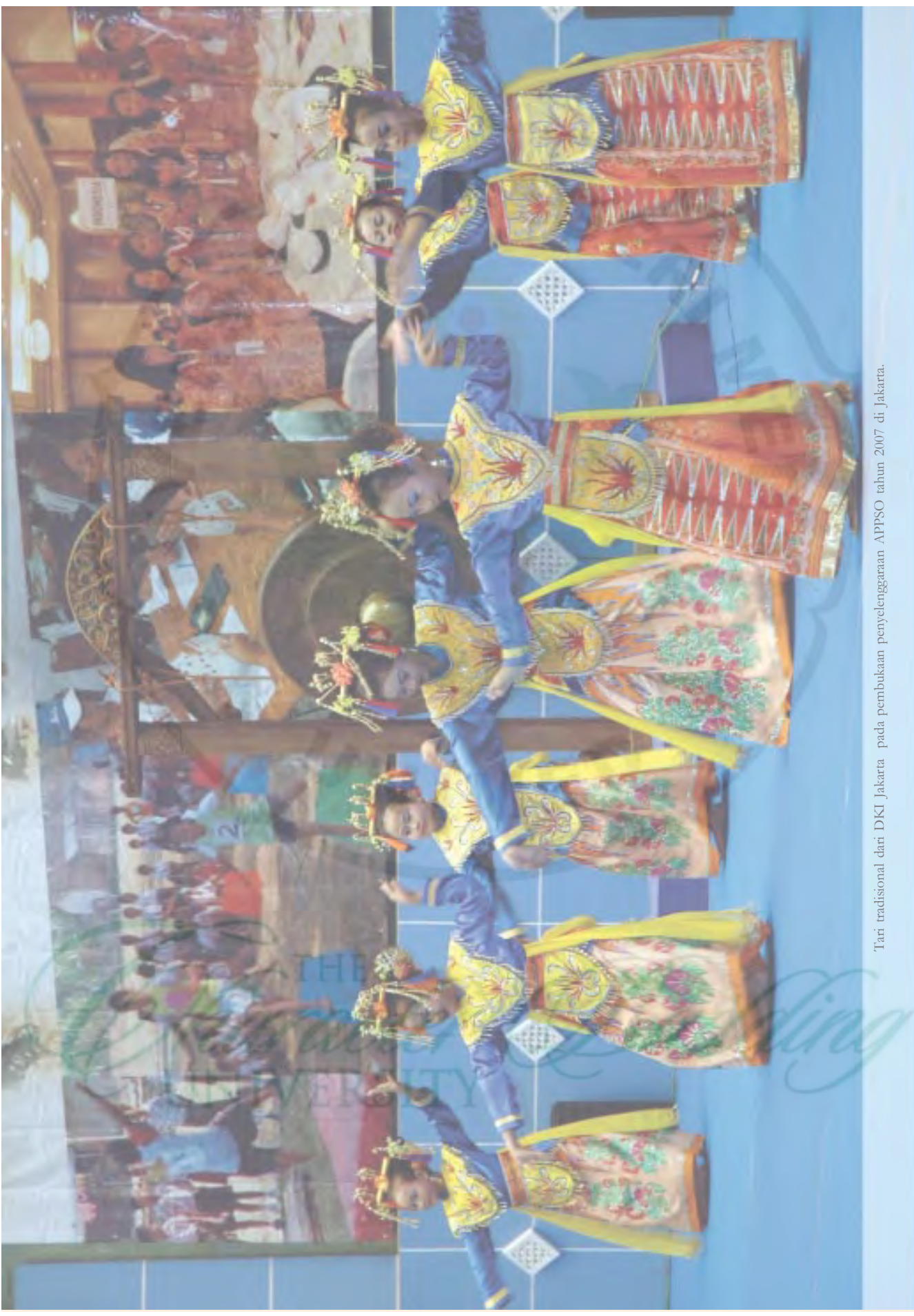
Tari tradisional dari DKI Jakarta pada pembukaan penyelenggaraan APPSO tahun 2007 di Jakarta.