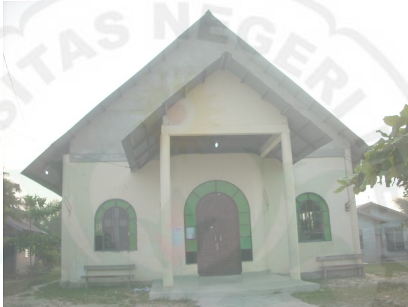
Gereja Kristen Protestan Indonesia (GKPI) Estomihi Palas Ressort Pekanbaru