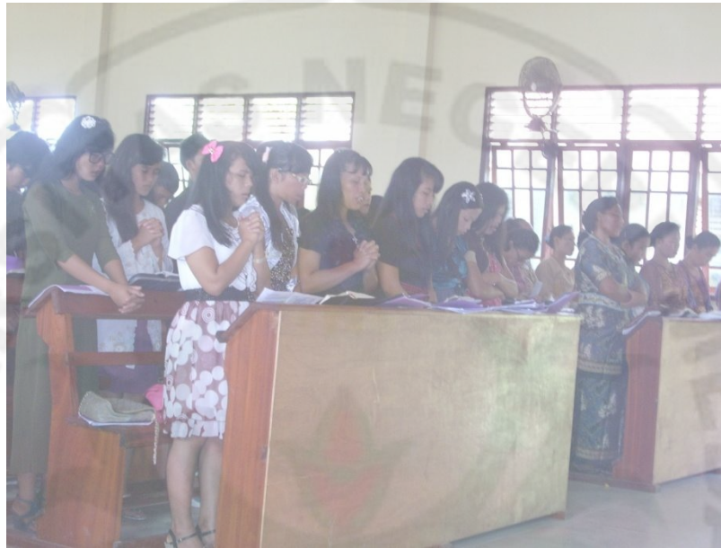
Pemuda-Pemudi GKPI Estomihi Palas Ressort Pekanbaru Dalam Melakukan Ibadah Setiap Minggunya (Dokumen Pribadi, Daniel Yosmar Heyman Manalu)