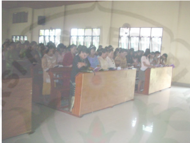
Tampak didepan kaum Ibu Jemaat GKPI Estomihi Palas Ressort Pekanbaru Dalam Mengikuti Ibadah setiap Minggunya