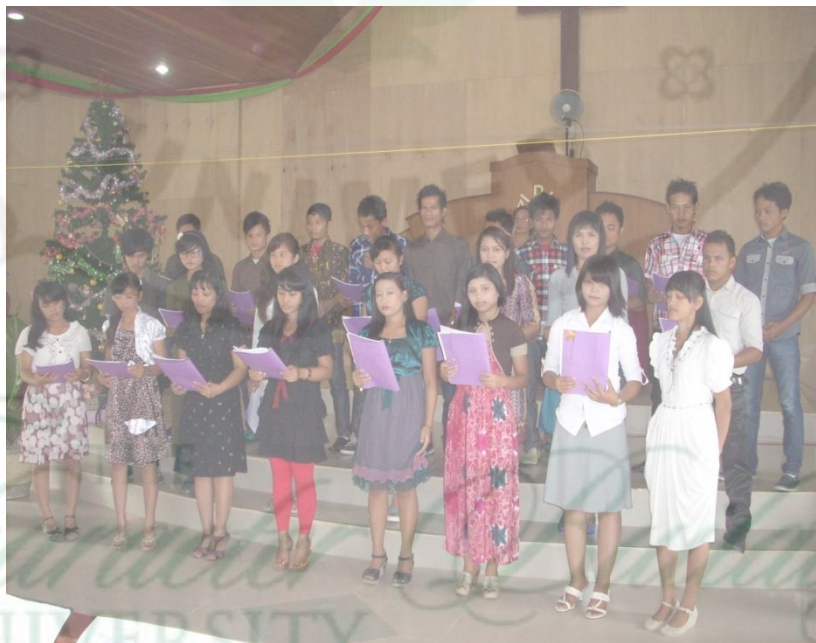
Pemuda-Pemudi GKPI Estomisi Palas Ressort Pekanbaru