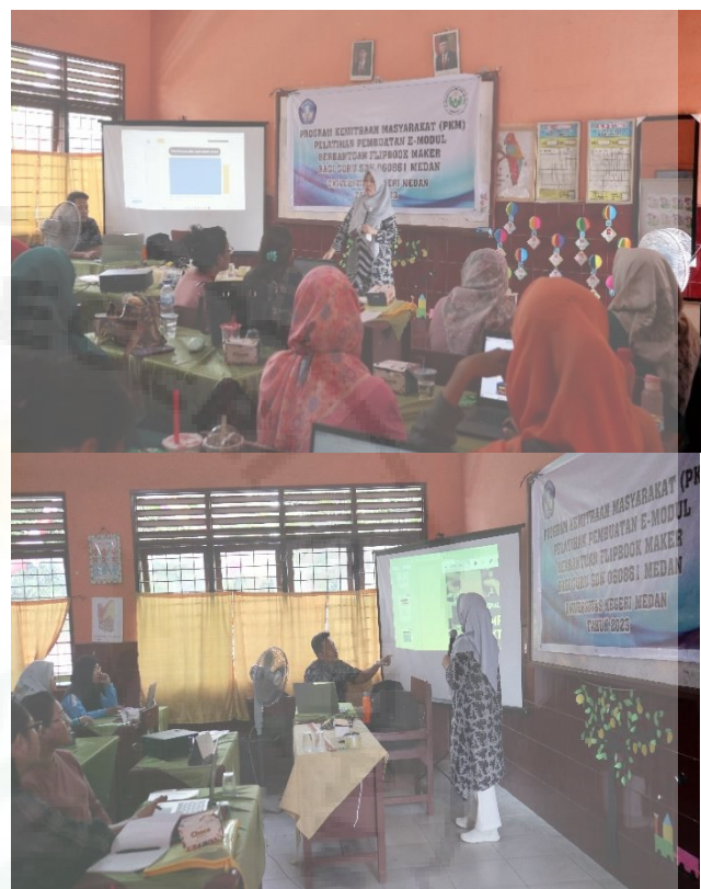
Gambar 2. Kegiatan Penyampaian Materi Pelatihan

Kegiatan yang dilakukan pada tahapan ini yaitu penyampaian materi tentang aplikasi flipbookmaker dalam merancang bahan ajar serta diskusi bersama mengenai kendala-kendala guru dalam memahami materi pelatihan yang diberikan. Narasumber dari kegiatan penyampaian materi ini adalah tim dosen dari JPTE UNIMED dan dibantu oleh lima orang mahasiswa yang juga berasal dari jurusan PTE UNIMED. Peserta pelatihan pembuatan e-modul ini terdiri dari 18 orang guru-guru SDN 060861 Medan. Sebelum pelatihan pembuatan e-modul, guru dipandu dan diperkenalkan terlebih dahulu dengan fitur-fitur yang bisa digunakan dalam merancang e-book menggunakan aplikasi flipbookmaker .