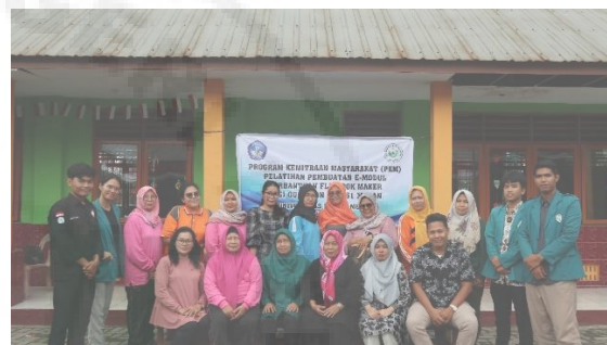
Gambar 5. Kegiatan Pengabdian Masyarakat di SDN 060861 Medan

Berdasarkan hasil respon guru terhadap pentingnya memanfaatkan TIK dalam mengembangkan bahan ajar inovatif yang meningkatkan ketertarikan dan juga motivasi siswa terhadap pembelajaran, didapatkan hasil bahwa 94 % guru setuju memanfaatkan TIK dalam mengembangkan bahan ajar dapat menarik minat dan motivasi siswa dalam pembelajaran.