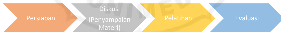
Gambar 1 Alur Kegiatan PKM

Kegiatan pelatihan dan pendampingan pembuatan e-modul ini dilaksanakan menggunakan metode diskusi dan sharing bersama mengenai penggunaan aplikasi flipbookmaker , pelatihan dan pendampingan pembuatan e-modul pada masing-masing mata pelajaran sesuai bidang keahlian guru. Adapun alur dari kegiatan ini dapat dilihat pada gambar berikut ini: