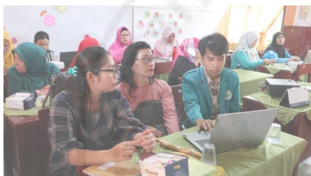
Gambar 3. Kegiatan Pendampingan Pembuatan E-Modul