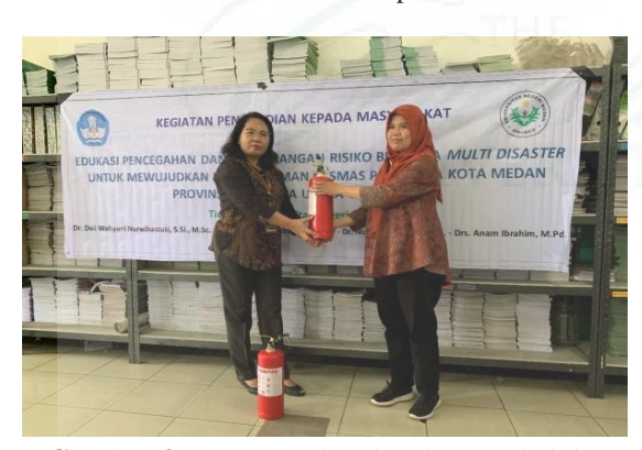
Gambar 8.c. Foto serah terima barang dari tim pengabdian Unimed kepada kepala sekolah berupa APAR (Alat Pemadam Api Ringan)