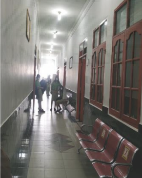
Gambar 5. Lorong kelas yang sempit dan tertutup