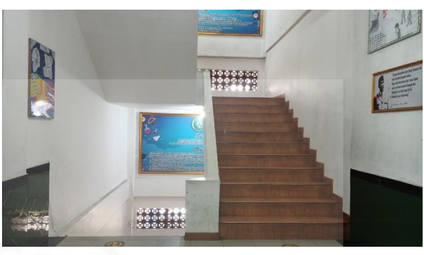
Gambar 6. Tangga naik turun akses dari lantai 1 ke lantai 4 (hanya ada 2 tangga kanan kiri)