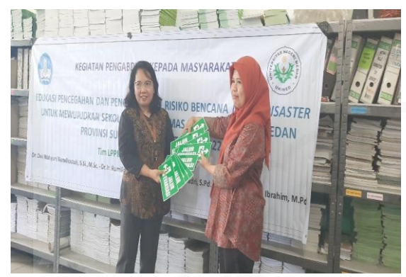
Gambar 8.a. Foto serah terima barang dari tim pengabdian Unimed kepada kepala sekolah berupa tanda jalur evakuasi

Ringan) akan dipasang di lantai 3 dan lantai 4. Gambar 8. menunjukkan foto serah terima barang dari tim pengabdian Unimed kepada kepala sekolah berupa tanda jalur evakuasi, tanda titik kumpul, dan APAR (Alat Pemadam Api Ringan).