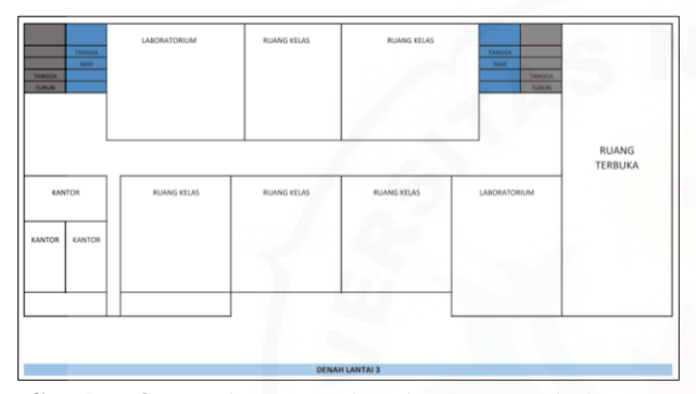
Gambar 3. Denah ruangan lantai 3 SMAS Primbana