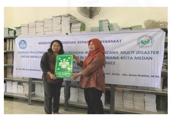
Gambar 8.b. Foto serah terima barang dari tim pengabdian Unimed kepada kepala sekolah berupa tanda titik kumpul