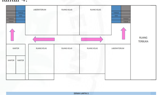
Gambar 6 . Jalur evakuasi di SMAS Primbana di lantai 3

Penentuan jalur evakuasi di SMAS Primbana dilakukan dengan focus group discussion (FGD) bersama siswa, guru, dan kepala sekolah. Siswa yang terlibat dalam FGD ini adalah siswa yang telah ditetapkan oleh sekolah sebagai agen perubahan untuk pengurangan risiko bencana di lingkungan sekolah SMAS Primbana. Dalam FGD ini, siswa diajak berfikir untuk merancang jalur penyelamatan tercepat dari gedung lantai 4 dan lantai 3 yang ditempati SMAS Primbana menuju ke halaman sekolah. Hasil rancangan jalur penyelamatan tercepat dari gedung lantai 4 dan lantai 3 kemudian digambarkan pada denah sekolah. Gambar 6. menunjukkan jalur evakuasi di SMAS Primbana di lantai 3. Sedangkan Gambar 7. menunjukkan jalur evakuasi di SMAS Primbana di lantai 4