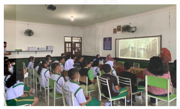
Gambar 2. Foto proses kegiatan sosialisasi dan pembinaan mengenai edukasi pencegahan dan pengurangan risiko bencana multi disaster di SMAS Primbana