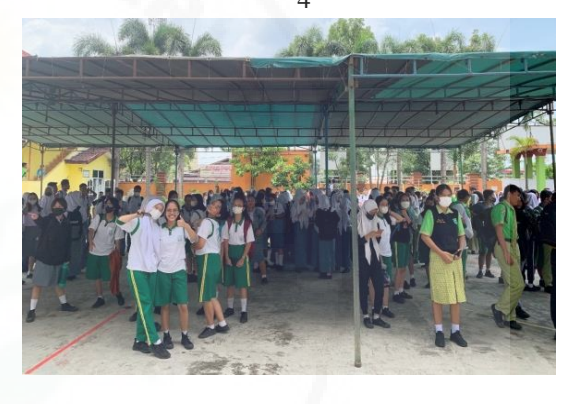
Gambar 5.a. Peserta simulasi yang telah berkumpul di halaman depan gedung sekolah