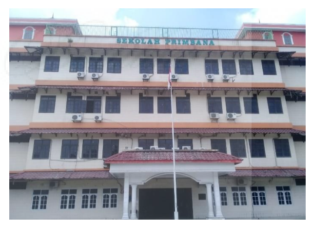
Gambar 1. Gedung sekolah nampak dari depan

Pengabdian ini dilakukan di Sekolah Menengah Atas Swasta (SMAS) Primbana Kota Medan Provinsi Sumatera Utara. SMAS Primbana dibangun pada tahun 2004 berada di Kota Medan dengan permukiman yang padat. SMAS Primbana berada pada bangunan gedung berlantai 5 yang sudah berumur 18 tahun. SMAS Primbana berada di lantai 3 dan lantai 4 dengan jumlah 12 ruang kelas. Lantai 1 digunakan untuk SDS Primbana dengan jumlah 8 ruang kelas. Sedangkan lantai 2 digunakan untuk SMPS Primbana dengan jumlah 8 ruang kelas. Gambar 1. dan Gambar 2. menunjukkan gedung sekolah nampak dari depan dan belakang. Sedangkan Gambar 3. dan Gambar 4. menyajikan denah ruangan di lantai 3 dan lantai 4 yang digunakan untuk SMAS Gedung sekolah Primbana. SMAS Primbana mempunyai lorong yang sempit dan tangga yang sempit juga dengan lebar kurang dari 1,5 meter, sehingga jika dilewati siswa pada jam dalam waktu yang bersamaan akan berdesakan. Lorong dan tangga sekolah dapat dilihat pada Gambar 5. dan Gambar 6.