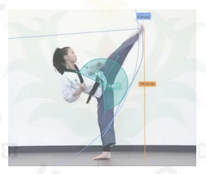
Gambar 1. Contoh Modeling Figure Analysis

Modeling Figure merupakan model analisis biomekanika yang secara sederhana dapat diterjemakan sebagai penggunaan video orang lain sebagai contoh atau figur gerakan yang akan dipelajari. Video figur dapat dipilih berdasarkan kriteria yang diingankan. Selanjutnya video figur dianalisis berdasarkan coaching point yang akan dipelajari. Atlet mencoba menirukan gerakan dan membandingkan dengan figur yang sudah diamati.