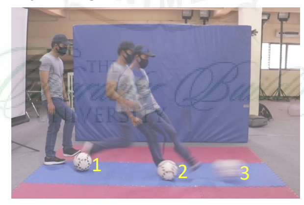
Gambar 3. Contoh StroMotion Analysis

StroMotion Analysis merupakan model analisis yang membagi gerakan menjadi beberapa tahapan gerak. Pada pembagiannya, tahapan gerak ini dapat disesuikan dengan coaching point yang akan diamati. Sehingga atlet dapat mengamati dan mengevaluasi gerakan pada masing-masing tahapan dengan seksama. Model analisis ini juga dapat diterapkan pada analisis modeling figure dan self-recording .