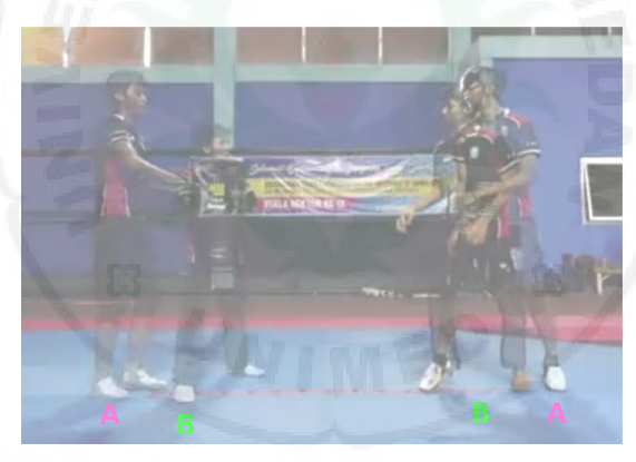
Gambar 4. Contoh SimulCam Analysis

SimulCam Analysis merupakan model analisis biomekanika yang membandingkan gerakan yang sama dalam dua video yang berbeda (video A dan video B). Sehingga pada hasil analisis dapat langsung dilihat perbedaan gerakan yang terjadi dengan jelas. Adapun syarat utama untuk melakukan analisis ini adalah frame video wajib sama. Artinya kedua video diambil dengan pengaturan jarak kamera dan penempatan objek yang sama.