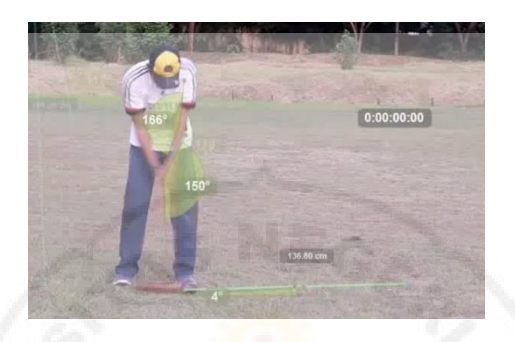
Gambar 2. Contoh Self-Recording Analysis