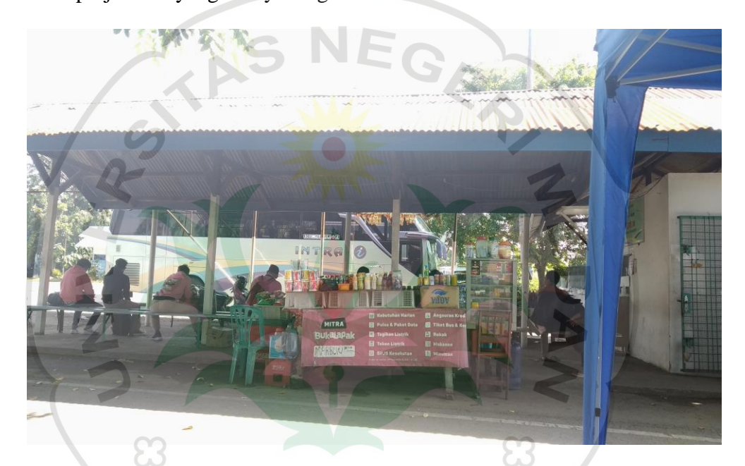
Gambar 1.3 Terminal Bus INTRA Amplas Medan

pelayanan yang sopan dan ramah, dan fasilitas yang memadai, sehingga dapat menikmati perjalanan yang menyenangkan.