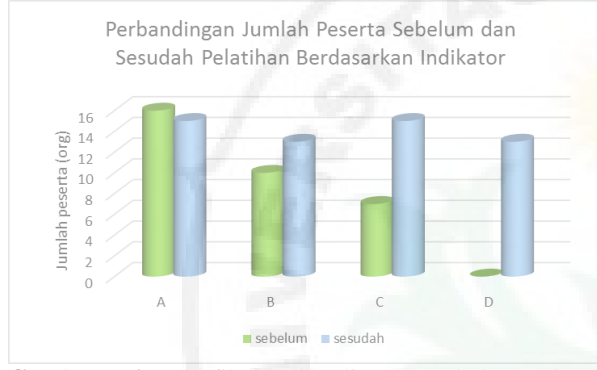
Gambar 6. Grafik perbandingan sebelum dan sesudah pelatihan

Berikut adalah data hasil perbandingan jumlah peserta sebelum dan sesudah kegiatan PKM. Hal ini berdasarkan beberapa indikator seperti yang tercantum pada tabel 1. Gambar 6 menunjukkan bahwa ada peningkatan pengetahuan yang dimiliki oleh para peserta. Seperti terlihat pada grafik, perbandingan antara sebelum pelatihan dan sesudah pelatihan memberikan nilai peningkatan terutama mengenai penggunaan aplikasi Google Classrom dalam pembelajaran daring. Peserta yang sebelumnya tidak kenal dengan aplikasi ini berlatih dan mempraktikkan penggunaan aplikasi ini.