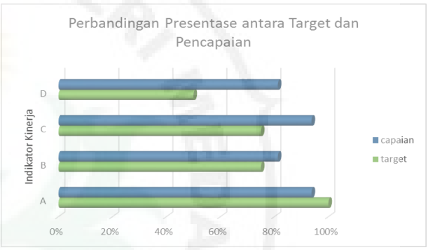
Gambar 7. Grafik perbandingan antara target dan capaian pelatihan

Dari keempat indikator pelaksanaan PKM ada 1 indikator yang tidak terpenuhi yakni jumlah peserta yang mengikuti kegiatan ini sampai selesai. Berdasarkan target, 100% jumlah peserta akan mengikuti pelatihan dari awal hingga selesai, namun ternyata dari 16 orang yang mengikuti kegiatan dari awal ada 1 orang yang tidak mengikuti hingga selesai. Hal ini dikarenakan faktor pribadi. Meskipun demikian, ketiga faktor lainnnya memperlihatkan hasil yang baik setelah dilaksanakannya pelatihan.