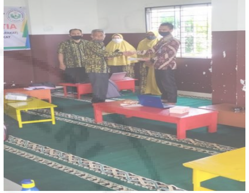
Gambar 4. Penyerahan Modul Pelatihan kepada peserta

3) Pelatihan aplikasi pembelajaran daring