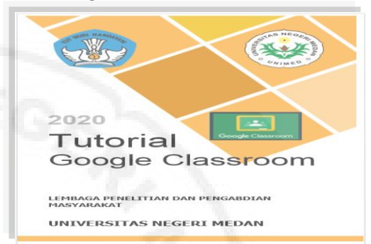
Gambar 1. Modul pelatihan yang digunakan

Pada PKM ini pelatihan menggunakan modul pelatihan sebagai berikut: