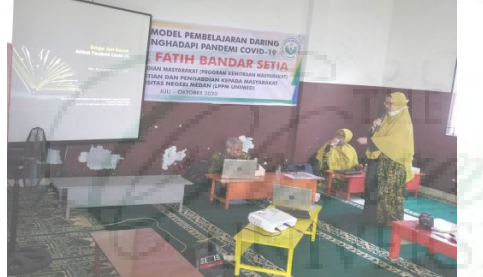
Gambar 3. Modul pelatihan yang digunakan

2) Pendampingan pemanfaatan model pembelajaran daring