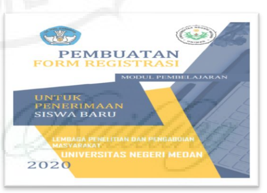
Gambar 2. Modul pelatihan yang