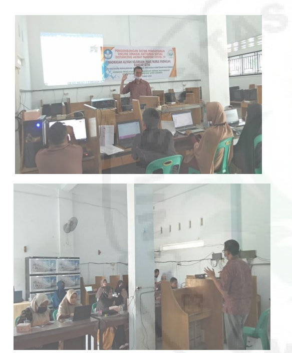
Gambar 4. Penyampaian materi pelatihan oleh salah seorang nara sumber

Kemudian Tim pelaksana menyampaikan materi yang telah disiapkan dengan metode ceramah dengan memberikan konsep website dan aplikasi online seperti google form.