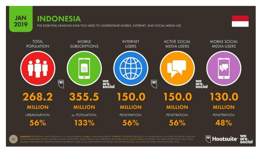
Gambar 1 Jumlah Pengguna Internet di Indonesia, Januari Tahun 2019 (www.hootsuite.com.).

Perkembangan dunia digital ibarat pisau bermata dua, ia dapat bermanfaat atau merugikan. Berkembangnya peralatan digital dan akses akan informasi dalam bentuk digital secara masif mempunyai tantangan sekaligus peluang. Berdasarkan penelitian We Are Social menyebutkan mobile subscriptions menyentuh angka 355,5 juta dengan penetrasi 133% sedangkan mobile social media users mencapai 130 juta dengan penetrasi 48%. Laporan We Are Social mengungkapkan bahwa Orang Indonesia rata-rata menghabiskan waktu untuk berselancar di internet dengan berbagai perangkat hingga delapan jam 36 menit. Sementara, rata-rata berkecimpung di medsos dengan berbagai perangkat hingga tiga jam 26 menit (www.hootsuite.com).